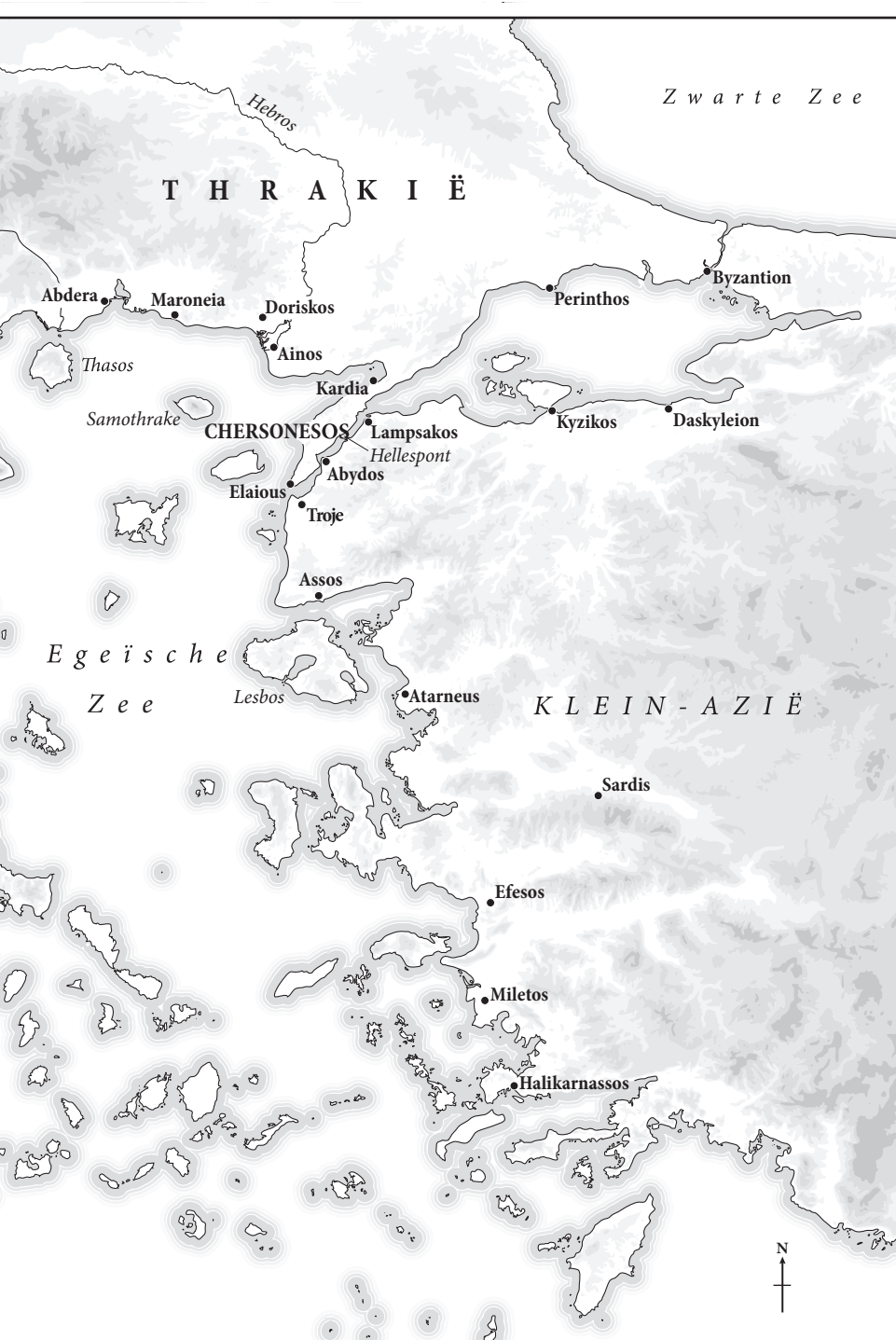
Griekenland, de Balkan en Klein-Azië (vierde eeuw v.Chr.)