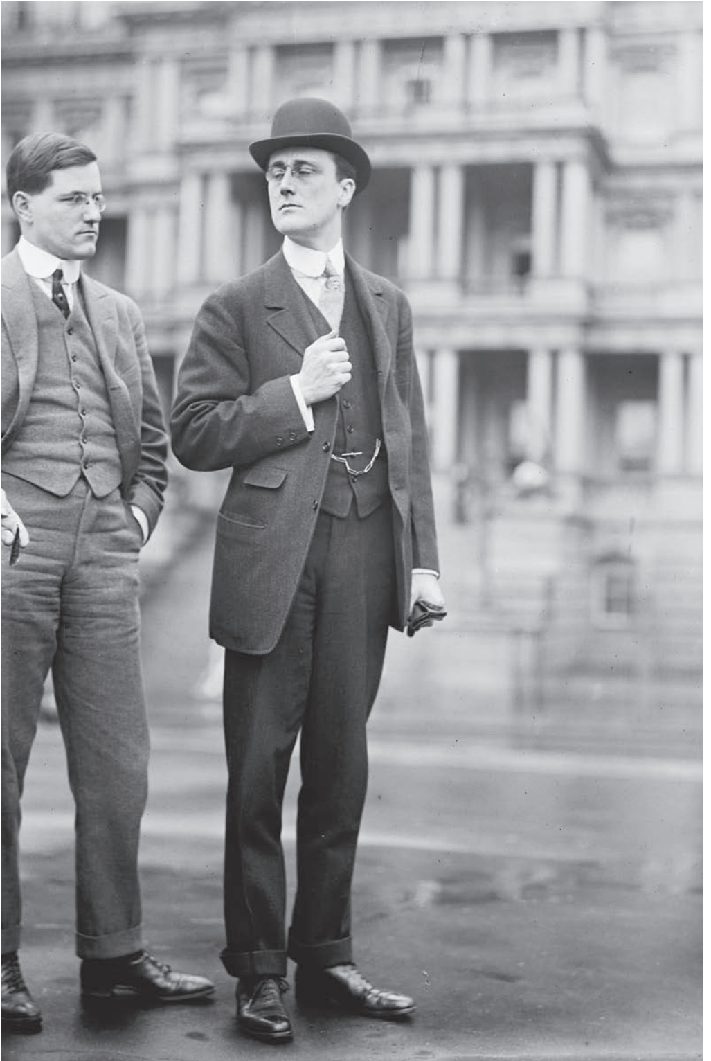
Franklin D. Roosevelt