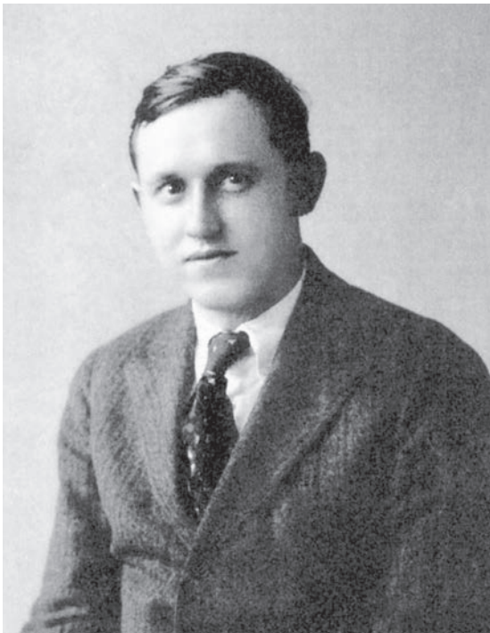
Harry Hopkins, 1916

Hopkins zei direct ja, hij zag in die tijd niets in dit sociale werk maar de kans om de sprong te maken naar New York liet hij niet lopen. 'Ik had nooit eerder in mijn leven een Joodse jongen gezien.' 9 Armoede had hijzelf ook wel meegemaakt, maar de honger en verloedering van de New Yorkse gettojeugd die hij in Camp Northover aantrof waren van een heel andere orde. Het maakte hem woedend. Christodora House wilde hem na die zomer graag houden. Hij kreeg er een baan als leider van de jongensgroepen, met gratis kost en inwoning, plus 5 dollar per maand als zakgeld.