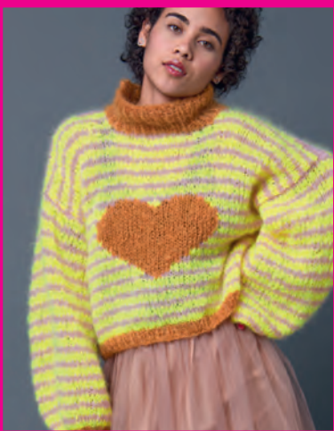
GOOD VIBES PULLOVER