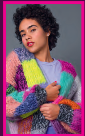
CHUNKY MOHAIR CARDIGAN