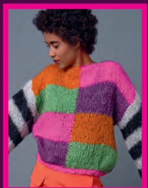
LIGHT MOHAIR PULLOVER