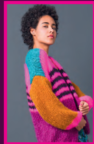
LOVERS MOHAIR CARDIGAN