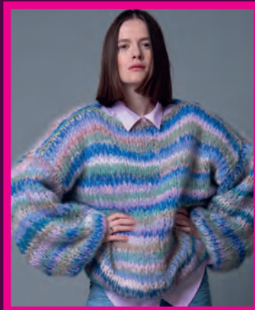
CHUNKY MOHAIR PULLOVER