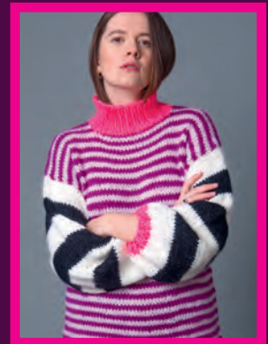
LONG STRIPED PULLOVER