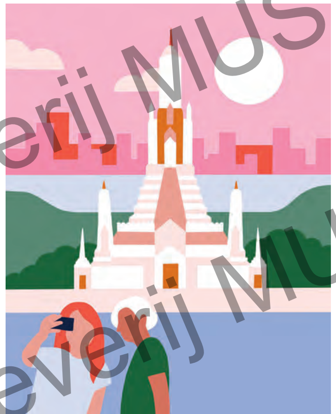
4. Bangkok (Thailand)