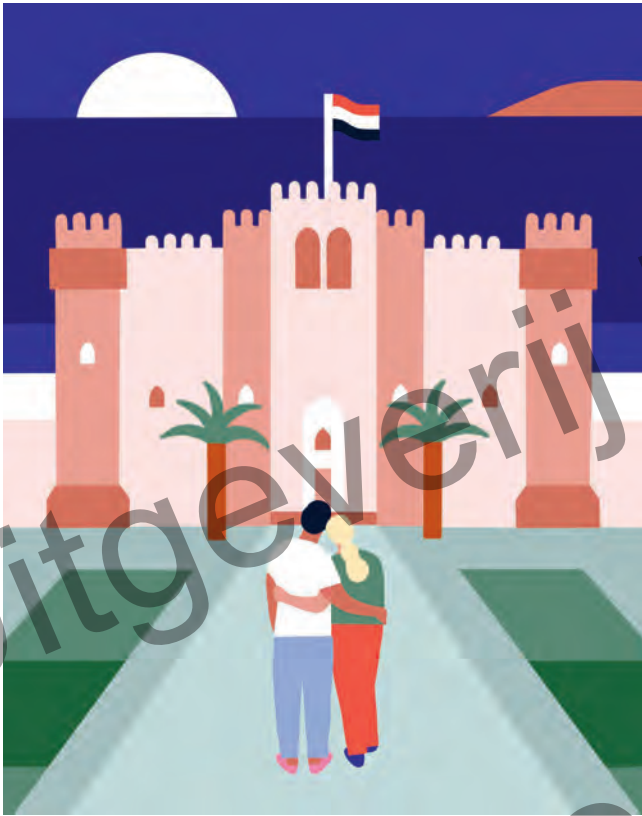
1. Alexandrië (Egypte)