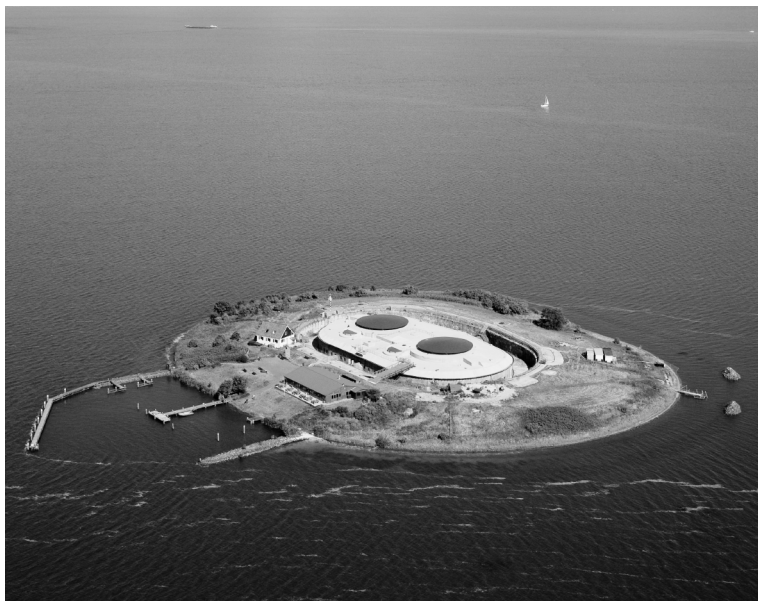
Het eiland Pampus vanuit de lucht.

grote watermassa van het IJsselmeer. ‘Kijk, Pampus!’ riep ik opgetogen. Op hetzelfde moment voelde ik een soort tragikomische schaamte over me komen dat ik mijn dochter – na alle culturele wonderen die wij nog diezelfde ochtend in het Archeologisch Museum hadden gezien – nu enthousiast probeerde te maken voor een lelijk, betonnen verdedigingswerk uit het eind van de negentiende eeuw, dat in het water ligt als een uit de hemel gevallen stuk ruimteschroot. Maar mijn dochter dacht er anders over en riep verheugd: ‘Het lijkt wel een stopcontact.’ En gelijk heeft ze: met zijn twee grote ronde gaten, waarin voorheen enorme draaibare Krupp-kanonnen stonden opgesteld, lijkt Pampus vanuit de lucht gezien precies op een stopcontact. Daar kun je heel goed de stekker in steken voor enkele inleidende observaties over Nederland, want er zijn weinig bouwsels die zo duidelijk en zo compact