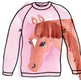
Paardentruï PAGINA 88