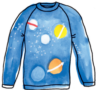
Planetentruï PAGINA 84