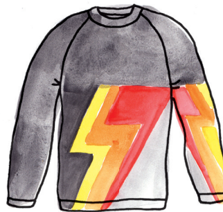
Discotruï PAGINA 70