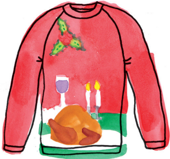
Kersttrui PAGINA 46