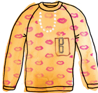
Damestrui PAGINA 54