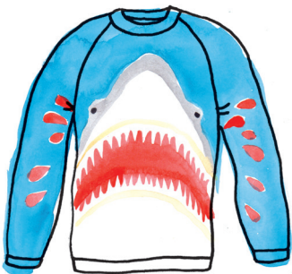
Haaientruï PAGINA 58