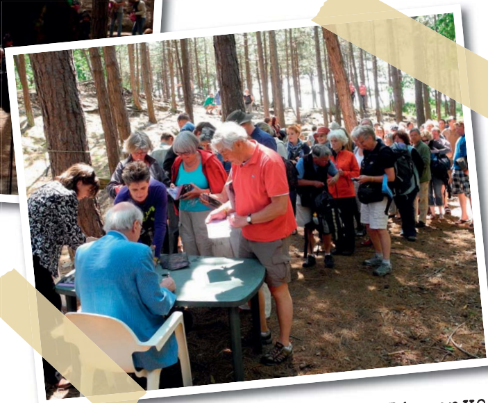
In de rij voor het luisterboek Dierenverhalen