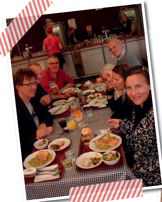
Eten en drinken