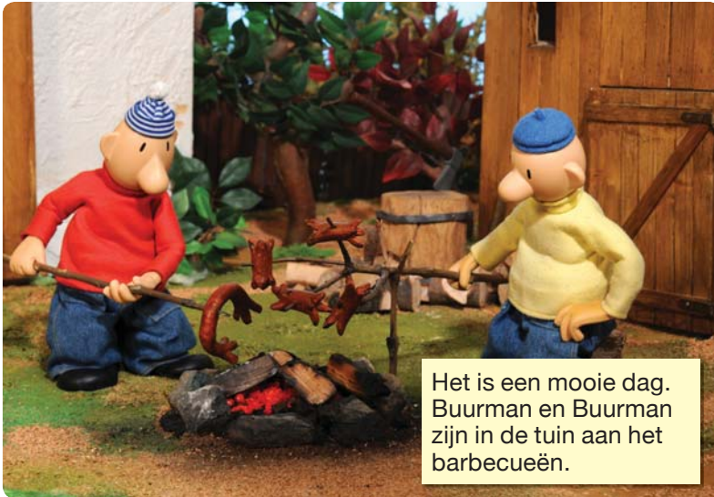
Het is een mooie dag. Buurman en Buurman zijn in de tuin aan het barbecueën.