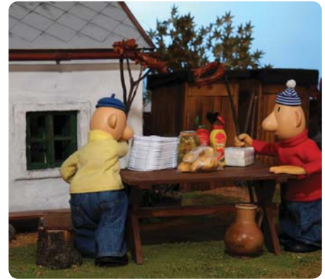
Ze nemen hun geroosterde kippetjes mee naar de tafel. Daar hebben ze allerhande spullen staan: augurken, ketchup en papieren bordjes om van te eten.