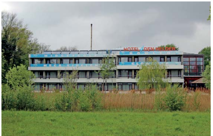
Mega-sjoelen en glowgolf in een hotel aan de rand van Den Helder. Mooier wordt het toch niet?

markante koepeltje ongetwijfeld weer horeca komt. Dwaal vervolgens via aantrekkelijke nieuwbouw en langs fraaie grachtjes naar de voormalige rijkswerf Willemsoord en alle negatieve gedachten over de marinestad verdwijnen. Dat gebeurt gegarandeerd na een wandeling door Huis-