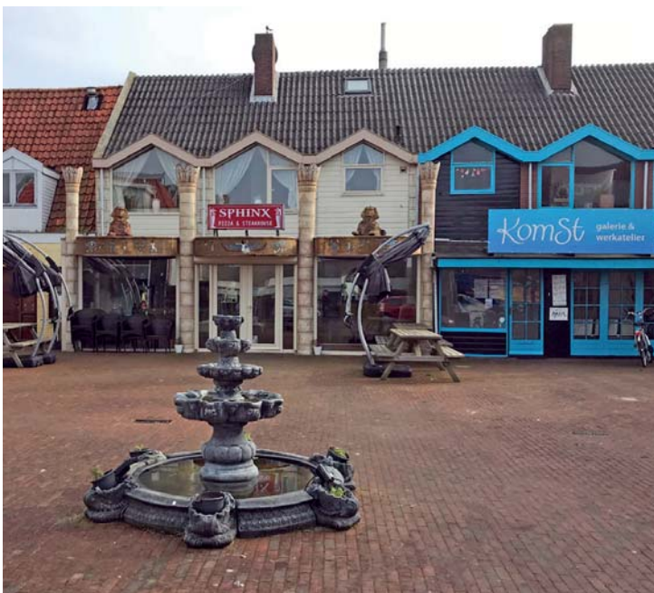
Den Helder staat bekend om de verfijnde architectuur, zoals hier op het Jutterspleintje.

ig en zo vol leven als voor de oorlog zal de stad wel nooit meer worden, maar de ergste treurnis lijkt hier langzaam weg te sijpelen. Hoe dan ook: Den Helder is een opmerkelijke en unieke stad en nu nog mooi van lelijkheid. Ga dat zien mensen, ga dat zien! ★