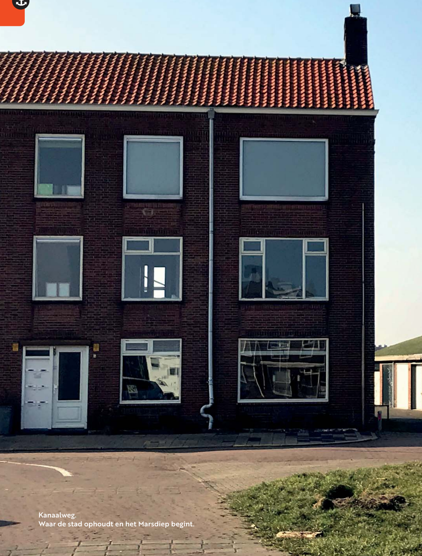
Kanaalweg. Waar de stad ophoudt en het Marsdiep begint.