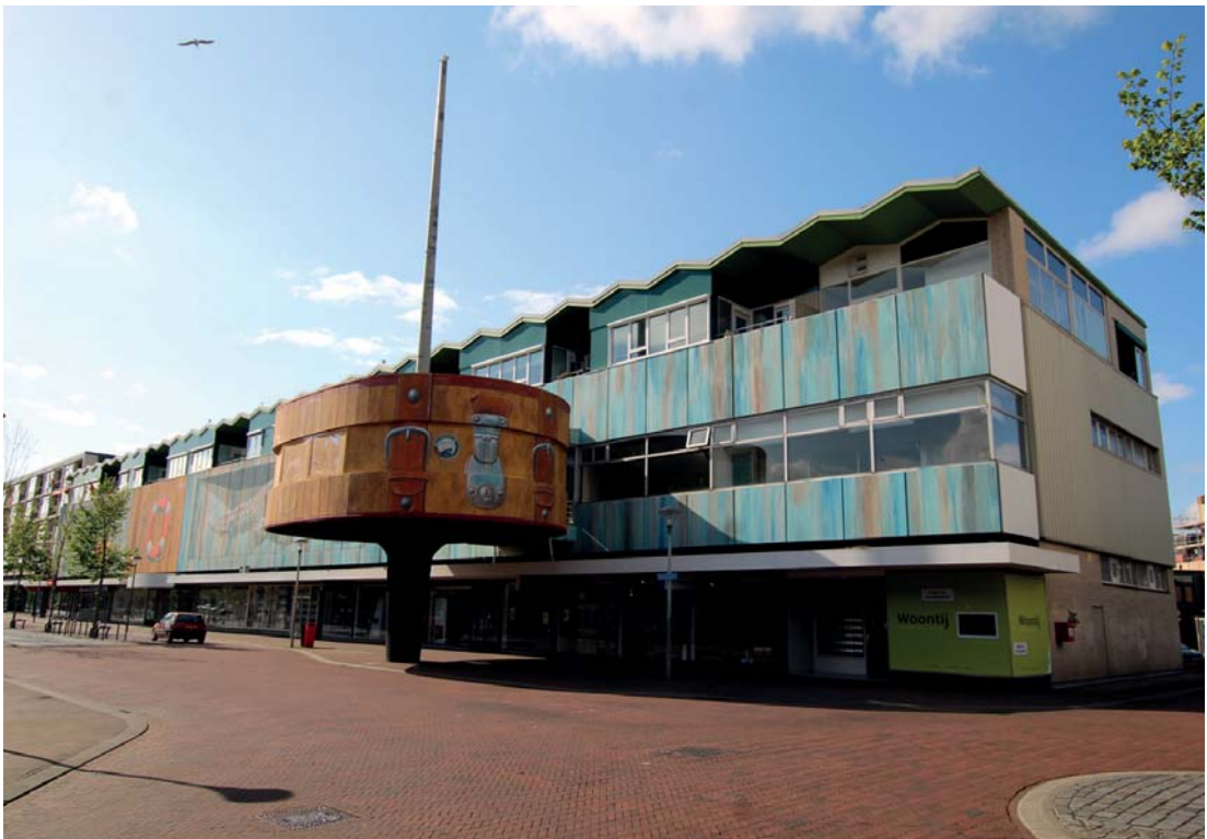
De voormalige V&D in de Beatrixstraat in 2017 en in 2019.