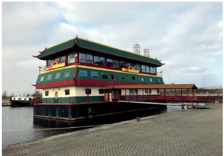
Al sinds 2013 ligt het voormalige Chinees-Indische restaurant North Palace, beter bekend als 'de bamiboet', verweesd in de haven van Den Helder.

Maar het is godzijdank niet alleen maar rozengeur en maneschijn. De leegstand van de winkelpanden is schrikbarend groot, alsof het spook van de crisis nog altijd door de Helderse binnenstad waart. En de Koningstraat, ooit het hart van nachtelijk Den Helder met de vele zeemanskroegen en disco's, is volledig doodgebloed. Dit dankzij het beleid van de gemeente om alle daar aanwezige horeca te verplaatsen naar Willemsoord. Wat rest is een desolate en naargeestige straat vol dichtgetimmerde panden, voor zover deze niet al zijn gesloopt tenminste. Een waar walhalla voor de treurtrippende mens, dat dan weer wel. En toch is de hoop op een betere toekomst voelbaar in de straten. Den Helder is echt allang niet meer zo triest en