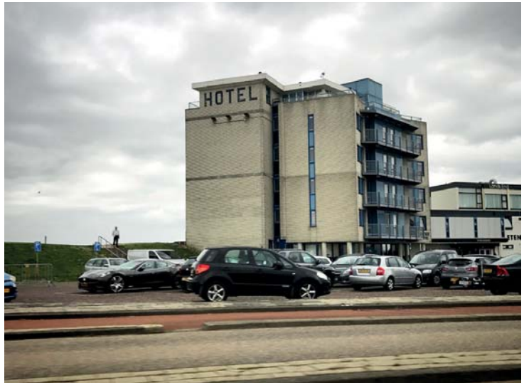
Hotel Lands End. De kamers mét ramen verschaffen vergezichten op de Waddenzee en op Texel. Die blinde muur is er omdat de hotelgasten anders uitzicht op Den Helder zouden hebben.

En natuurlijk, wie met de trein aankomt op het station dat het einde van de wereld inluidt en het have-loze pand ziet waar visrestaurant Boon in is gevestigd, een blik werpt op de ietwat uit de toon vallende Hema en de goedkope huurwoningen langs het spoor, ja, dan laat de stad zich niet meteen van haar beste kant zien. Al is dit natuurlijk allemaal al wel mooi van lelijkheid. Maar loop eens de Beatrixstraat in, een winkelstraat die eind jaren vijftig werd aangelegd, en je stuit meteen op het prachtige wederopbouw-pand waar voorheen de v&d in zat. Zoals in veel steden staat ook deze voormalige v&d te verkommeren, maar de plannen zijn legio, waarbij in het