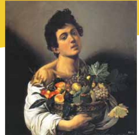
Caravaggio (1571-1610) Jongen met fruitmand, 1594 Galleria Borghese, Rome

Hoe groter het verschil tussen twee dingen, hoe groter het contrast. Een paar voorbeelden; het is heel stil op straat maar opeens begint iemand keihard te trommelen. Dan is er contrast tussen stilte en lawaai. Of als je een zoute haring eet en daarna meteen een zoet taartje. Dat is een smaakcontrast. Ken je nog meer contrasten?