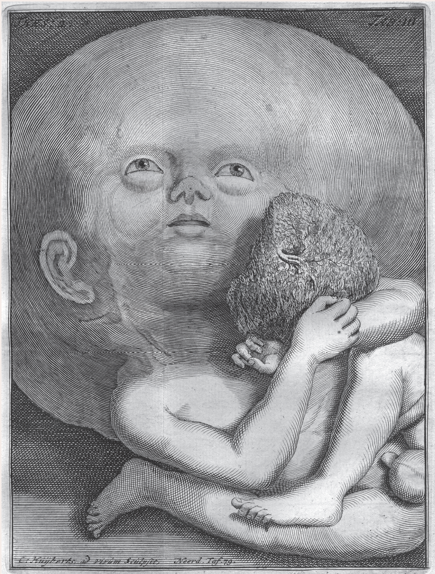
Waterhoofdig Kint, van zes of seven maanden. Prent uit Alle ontleed- geneeskunde- en heelkundige werken van Frederik Ruysch (1744), Cabinet II, Prent 3. Digitale Bibliotheek voor de Nederlandse Letteren.