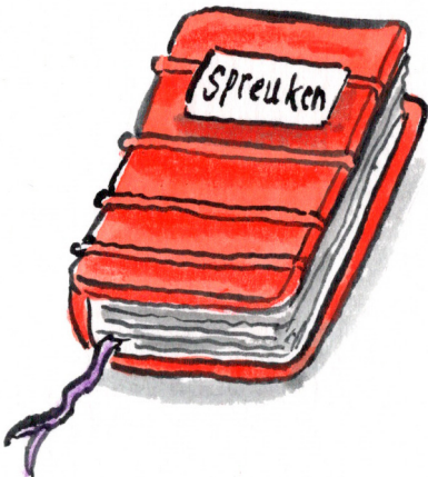
Het boek met spreuken