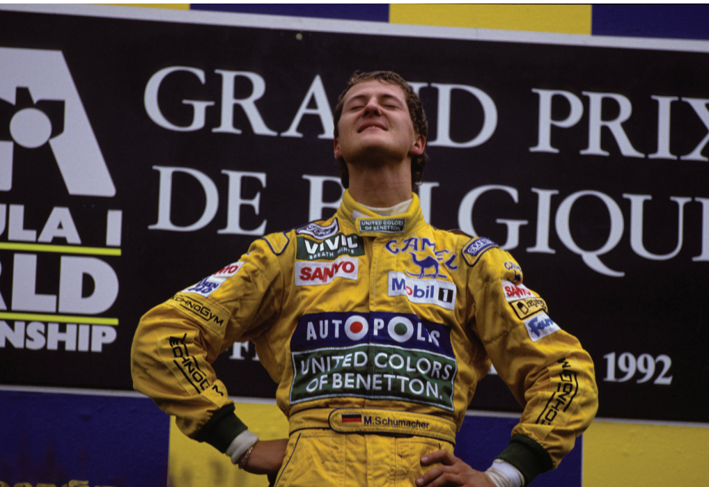
Schumi's eerste Grand Prix-zege in Spa, in 1992.