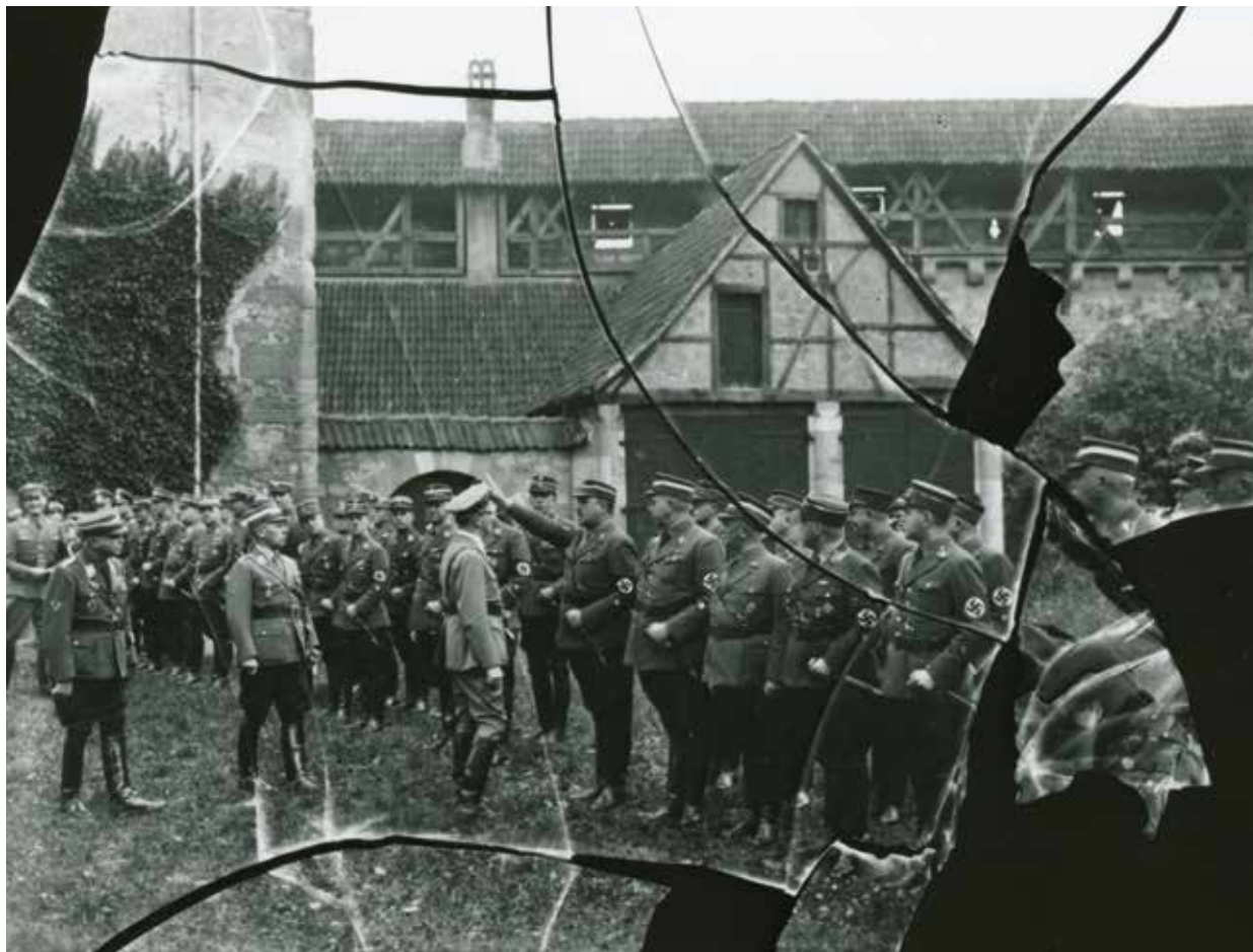
Omgeving Neurenberg, september 1936. Beschadigd geraakte glasplaat-negatief uit het omvangrijke fotoarchief van fotograaf Heinrich Hoffmann, dat in 1949 door het Amerikaanse leger naar de VS werd verscheept. Hitler bezoekt een eenheid van het Nationalsozialistisches Kraftfahrkorps (NSKK), de gemotoriseerde afdeling van de nazibeweging. Tweede van links: Adolf Hühnlein. Korpsführer van het NSKK.