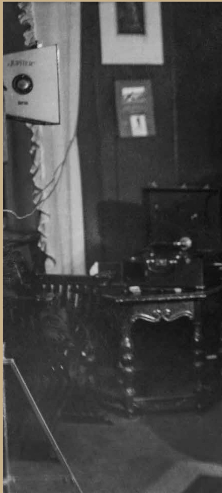
München, augustus 1927. Opname in de studio van Hoffmann in de Schellingstrasse 50.

Aanleiding voor de opnamesessie is Hoffmanns terugkerende probleem om tijdens publieksbijeenkomsten in de vaak donkere locaties van dichtbij goed uitgelichte, scherpe opnamen van de sprekende Hitler te maken. De geënceneerde studio-opnamen dienen als alternatief en moeten (potentiële) aanhangers, die niet in de gelegenheid zijn de NSDAP-leider met eigen ogen te zien, een indruk geven van zijn bevlogenheid en charisma. De foto's worden vanaf begin 1928 verschillende malen gepubliceerd in het NSDAP-tijdschrift Illustrierter Beobachter . De fotopostkaarten worden tot ver in de jaren dertig te koop aangeboden. 33