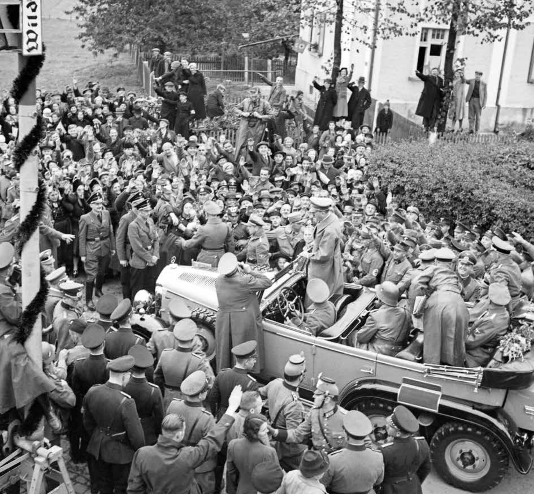
Asch, Sudetenland 3 oktober 1938. Als uitvloeisel van de Conferentie van München trokken Duitse troepen op 1 oktober 1938 Sudetenland binnen. Twee dagen later worden Hitler en zijn gevolg in de grensplaats Asch (Aš) enthousiast ontvangen door de Duitstalige bevolking. Fotograaf Heinrich Hoffmann, staand naast Hitlers Mercedes legt het historische moment vast.