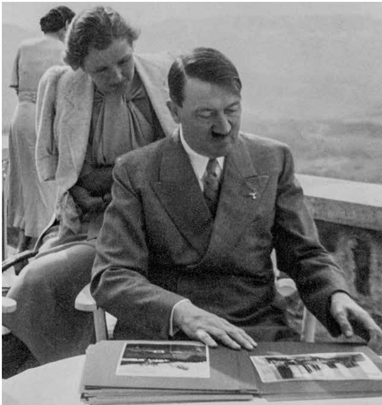
Berchtesgaden, 16 mei 1937. Op het terras van de Berghof op de Obersalzberg bekijken Hitler en Eva Braun een album met losse fotobladen.