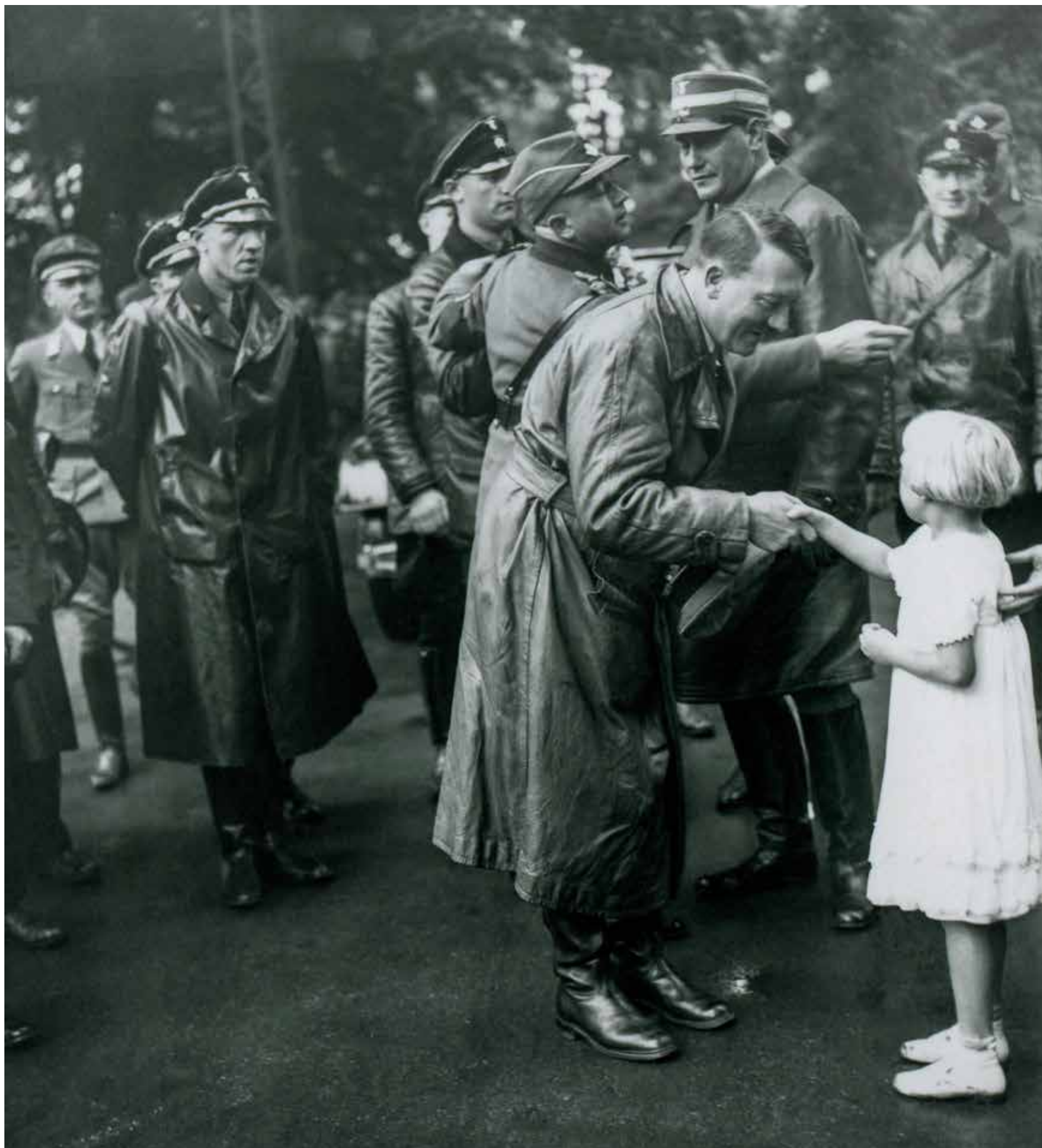
Lünen, Noordrijn-Westfalen, 29 juni 1934. Hitler bezoekt een opleidingskamp van de Reichsarbeitsdienst (RAD).