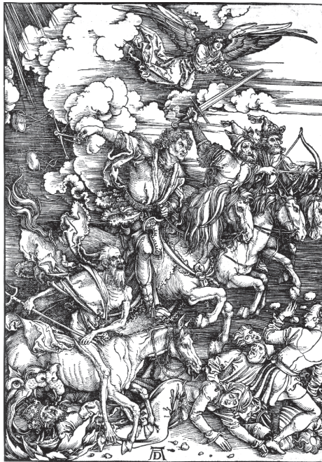
Albrecht Dürer, De Vier Ruiters van de Apocalyps (1498).

De Dag der Wrake wordt aangekondigd door een geweldige aardbeving, een zonsverduistering en een bloedmaan. De sterren vallen op de aarde en de bergen en eilanden worden 'van hun plaats verschoven'.