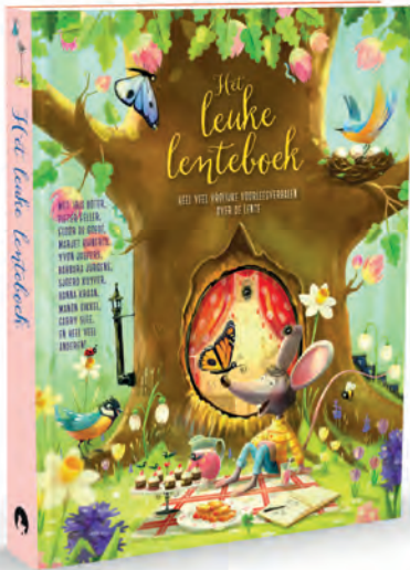
Het leuke lenteboek