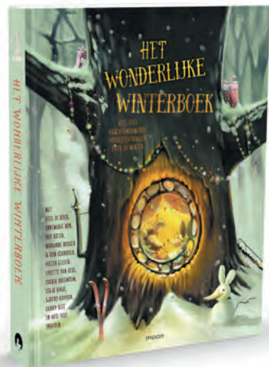
Het wonderlijke winterboek