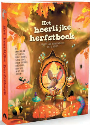
Het heerlijke herfstboek