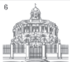
6 SHELDONIAN THEATRE