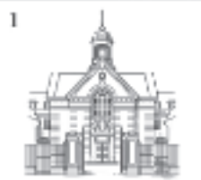
1 ST. HUGH'S COLLEGE