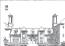
2 SOMERVILLE COLLEGE