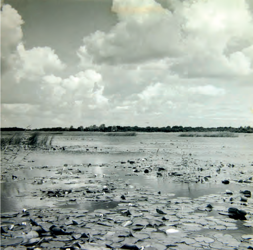
Het Naardermeer.