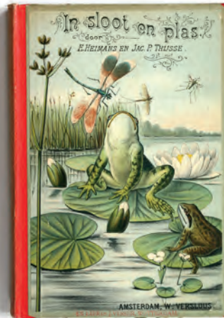
De eerste boekjes van Eli Heimans en Jac. P. Thijsse. Van vlinders, bloemen en vogels (1894) en In sloot en plas (1895).