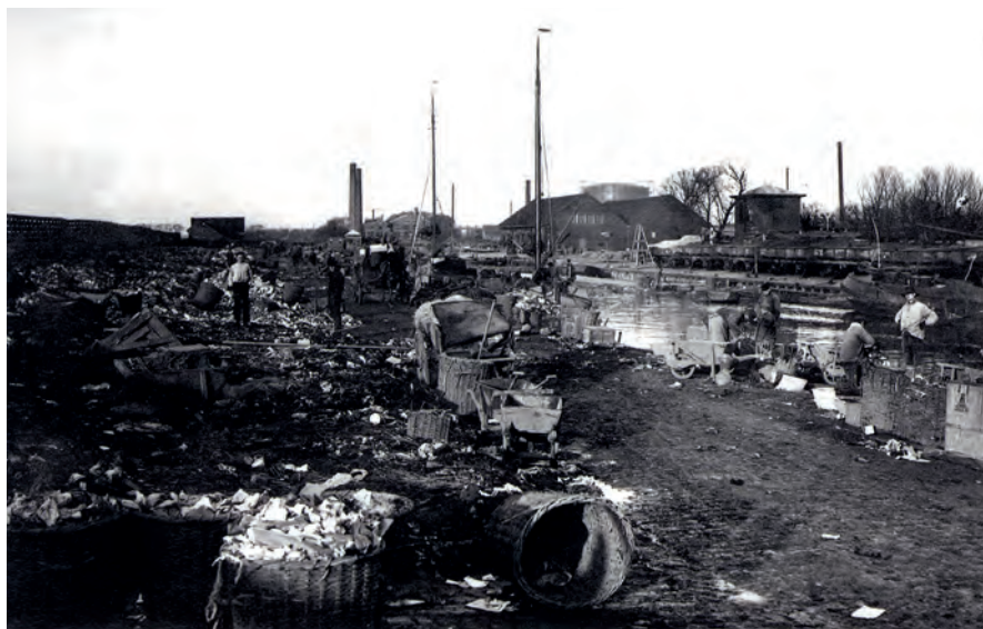
Centrale vuilnisbelt, Kostverlorenvaart Amsterdam. Omstreeks 1885–1900.

gekeurd, maar er werden vast gesprekken gevoerd met de eigenaar van het Naardermeer, de familie Rutgers van Rozenburg. Ook werd contact opgenomen met de potentiële vervoerders, de Hollandse IJzeren Spoorwegmaatschappij en de Gooische Stoomtram-maatschappij. Dat er met dit project een natuurgebied verloren zou gaan, kwam niet in de hoofden van de bestuurders op. Het ging immers om een onvruchtbaar en dus ‘waardeloos’ plassengebied.