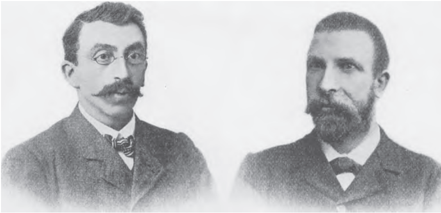
Dubbelportret van Eli Heimans en Jac. P. Thijssen aan het begin van hun samenwerking.