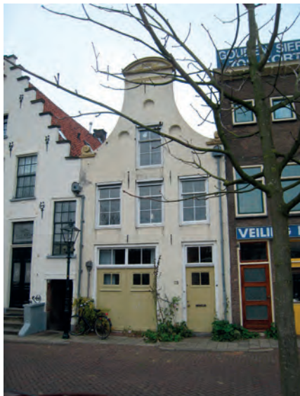
Het geboortehuis van Eli Heimans aan De Dijk 1. 127, thans Thorbeckegracht 73, in Zwolle. Het huis dateert van 1698.