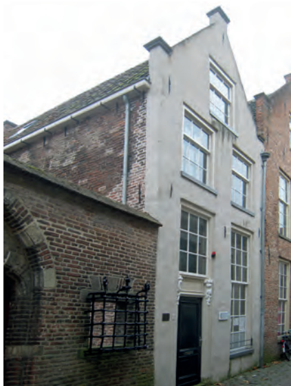
Twee jaar na zijn geboorte verhuisde Eli met zijn familie naar de Papestraat 5 in Zwolle. Naast de voordeur is een koperen plaat bevestigd met een tekst van Fred Nordheim over Eli Heimans. Foto: Marga Coesèl, 2013.