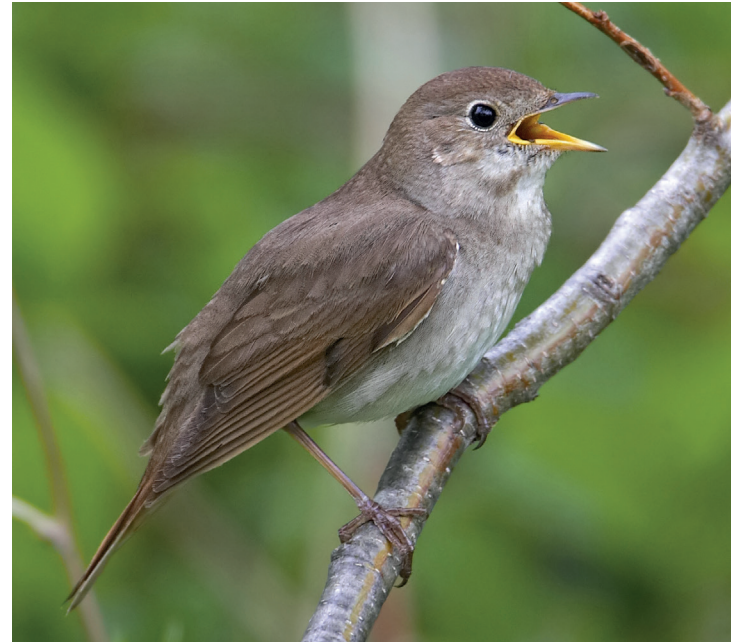
Noordse nachtegaal Luscinia luscinia .

Nog een familielid van de nachtegaal is de blauwborst, de Cyanecula svecica zoals zijn wetenschappelijke naam luidt. Geen Luscinia , maar vroeger werd deze blauwborst tot hetzelfde geslacht gerekend als de beide nachtegaalen.