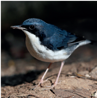
Blauwe nachtegaal ( Larvivora cyane ).