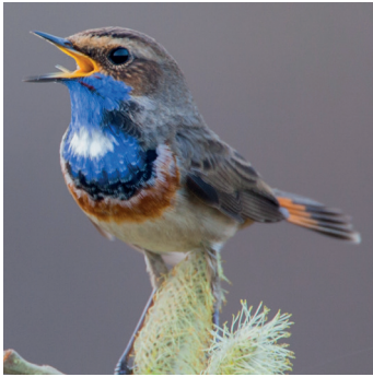
Blauwborst ( Cyanecula svecica ).