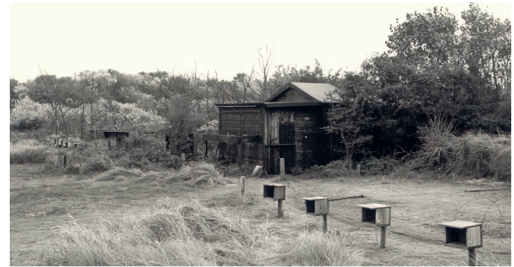
De voormalige vinkenbaan in Wassenaar.

op de plek van de vinkenbaan in Wassenaar de Atlantikwall gebouwd, de verdedigingslinie die de Duitsers bouwden om een geallieerde invasie te voorkomen. De duinen werden spergebied en het ringstation is toen ontmanteld. Na de Tweede Wereldoorlog werd het ringstation op de huidige plek in Meijndel herbouwd. Onder de koffie vertelt Vincent over het ontstaan van het vogelringstation Meijndel. Eigenlijk is dat de voorzetting van de oude vinkenbaan in Meijndel. Het vangen van vinken was een hele cultuur. Met name in de trektijd werden duizenden vogels gevangen om te eindigen als kooivogeltje, in de pan of op de hoed van echtgenotes. De regering gaf er zelfs ‘vinkenvrij’ voor – een soort reces om in het najaar vogels te kunnen vangen.