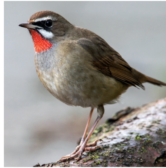
Roodkeelnachtegaal ( Calliope calliope ).