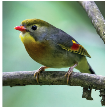
Japanse nachtegaal ( Leiothrix lutea ).

Hoewel allemaal verre verwanten van elkaar, lijken de namen vooral ingegeven door het gedrag of het uiterlijk van de vogels. Het zijn allemaal foeragerende grondvogels met een lijsterachtig silhouet, ze hebben dus alleen een oppervlakkige overeenkomst met onze nachtegalen.