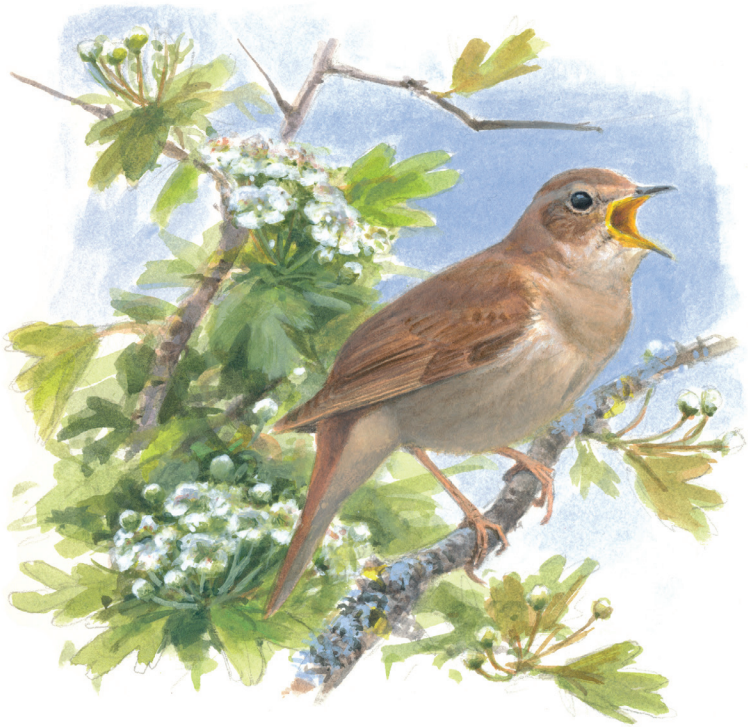
Nachtegaal zingend in meidoorn (Elwin van der Kolk).

Ons gevoel voor rechtvaardigheid wil dat talenten eerlijk verdeeld zijn. We stellen met instemming vast dat de pauw, met zijn prachtige tooi, een akelig stemgeluid heeft. En dat fraaie zangvogels als de zanglijster en de fitis een onopvallend verenkleed hebben. Alsof wie mooi kan zingen, niet mooi mag zijn. Zo wordt de nachtegaal vaak aangeduid als een bescheiden vogel met een prachtige stem maar een onopvallend verenkleed. Toch, met zijn roestbruine kleuren en prachtige, subtiel kastanjerode staart, mag hij er wezen. Aan de onderzijde zijn nachtegalen lichter: van grijsbruin verloopt het naar een zuiver witte keel en onderbuik. Die rossige staart valt vooral op als de nachtegaal vliegt. De vlucht is snel en licht en bijna altijd laag. Mooi zijn ook die grote ogen, omgeven door een witte oogring. Volgens Engelse vogelboeken geeft dat de nachtegaal een gentle expression .