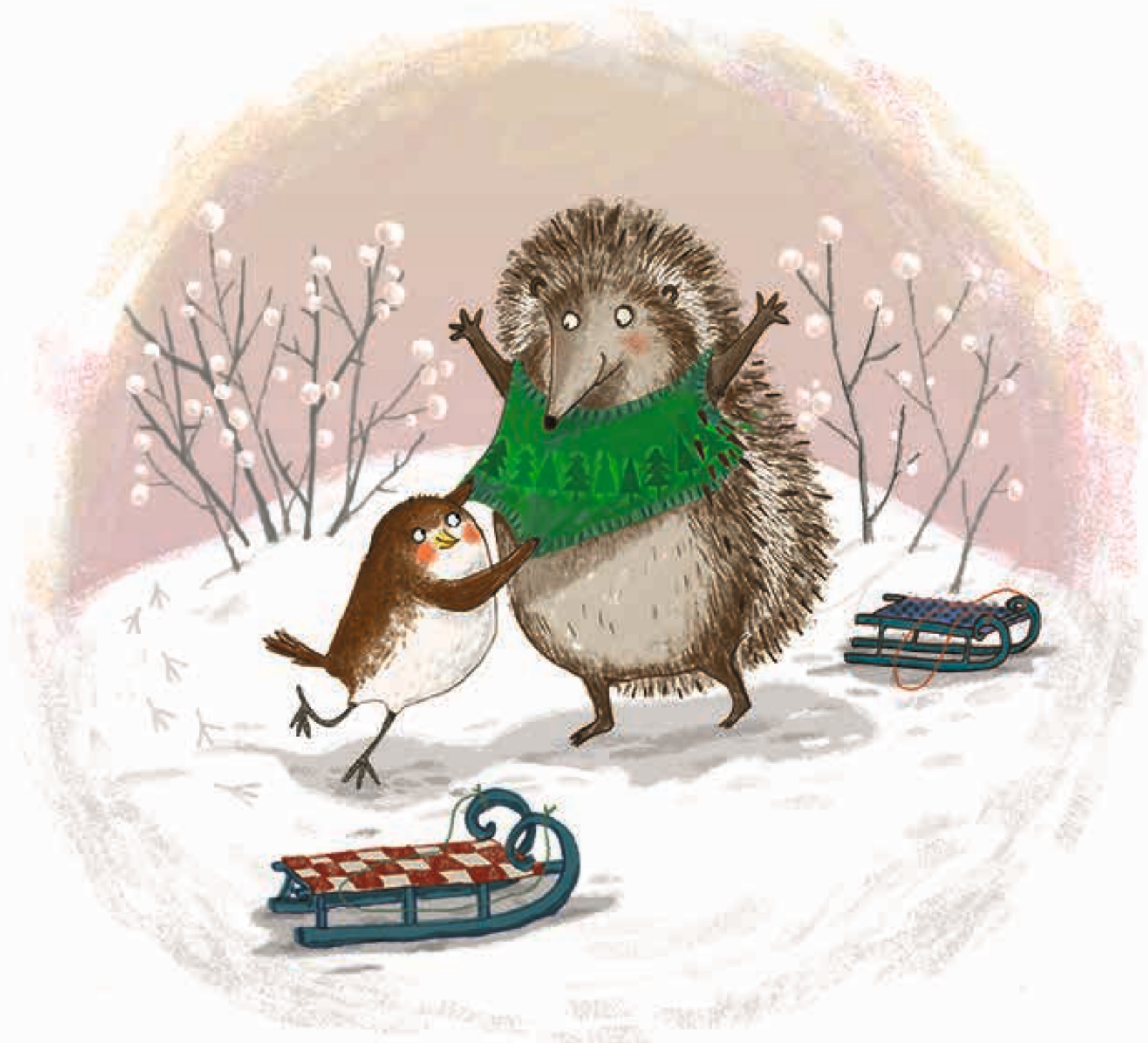
Vogeltje geeft Egel zijn groene truitje.