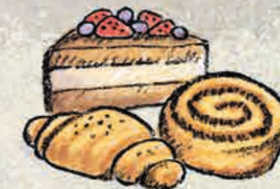
croissantjes en gebakjes