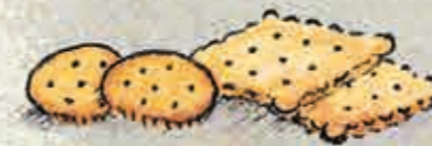
crackers en biscuitjes