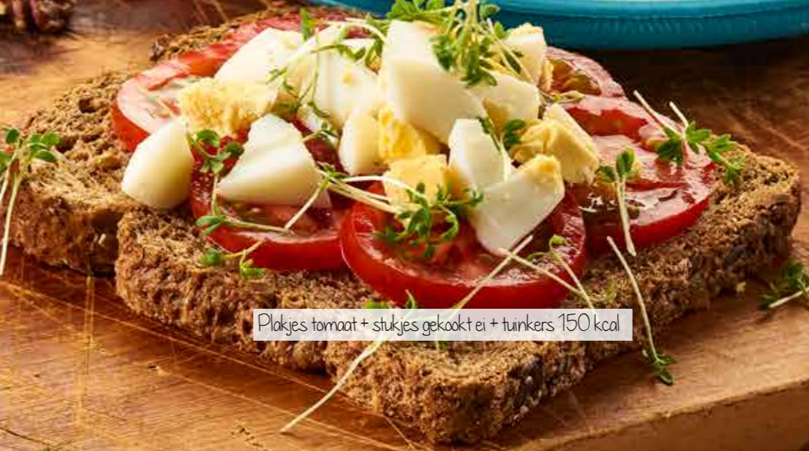
Plakjes tomaat + stukjes gekookt ei + tuinkers 150 kcal