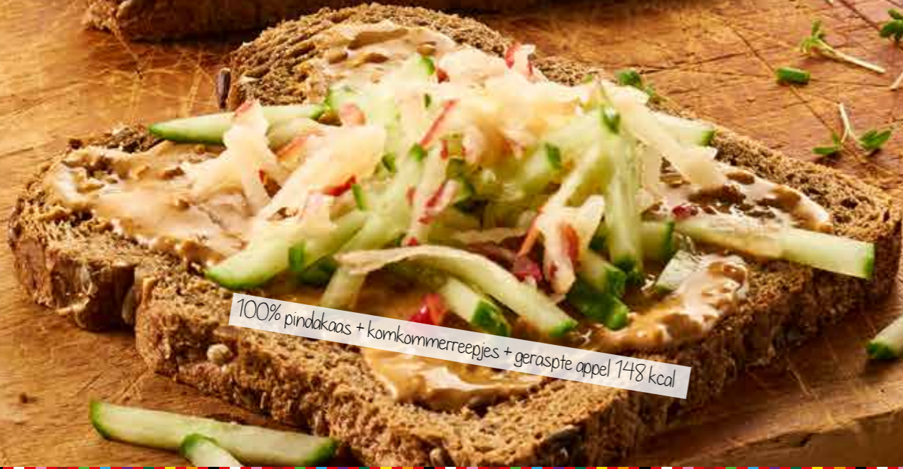
100% pindakaas + komkommerreepjes + geraspte appel 148 kcal