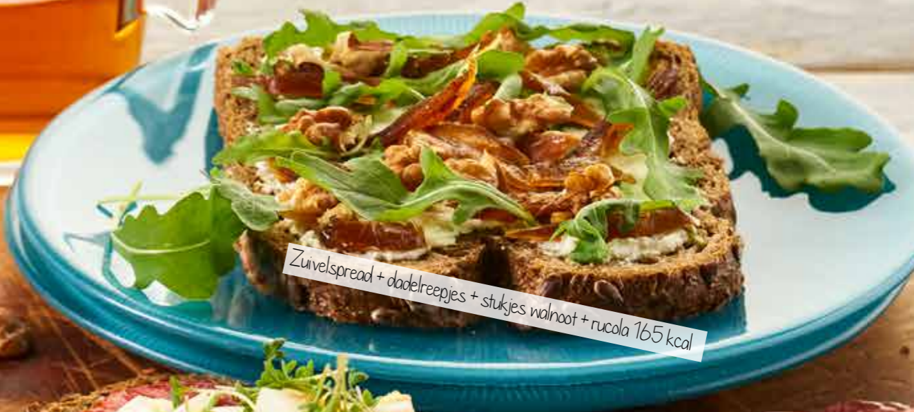
Zuivelspread + dadelreepjes + stukjes walnoot + rucola 165 kcal