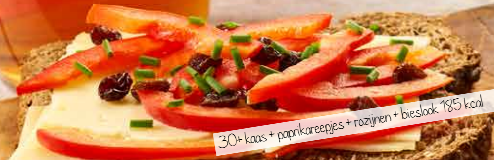
30+ kaas + paprikareepjes + rozijnen + bieslook 185 kcal