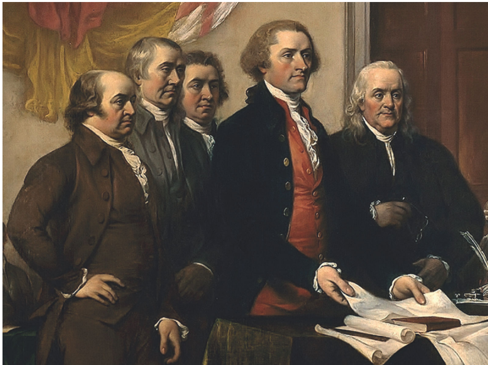
De vijf ontwerpers van de Onafhankelijkheidsverklaring presenteren de verklaring aan John Hancock, President van het Continental Congress. V.l.n.r. John Adams, Roger Sherman, Robert Livingston, Thomas Jefferson en Benjamin Franklin. Detail uit het beroemde schilderij van John Trumbull. (Capitool, Washington)