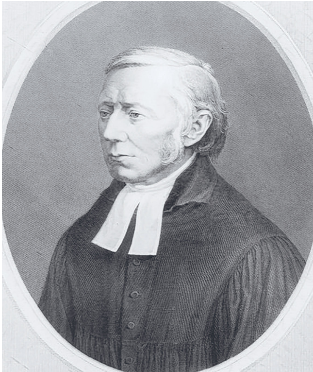
Theodor Fliedner (1800–1864), een van de pioniers binnen de negentiende-eeuwse diaconessenbeweging.

'Hoe onrecht en onwijs handelen daarom die andere evangelische kerken, dat zij hen [vrouwen] geen bepaalde werkring bieden door het toewijzen van de zorg voor vrouwelijke armen, zieken en gevangenen? Hoeveel vrouwen, weduwen, met name predikantsweduwen en oudere vrijgezelle vrouwen, zou daardoor een nieuw, lieflijk veld geopend worden, om tranen van ellende te drogen, en zondaresen met hun Heiland en de wereld te verzoenen [...].' 5