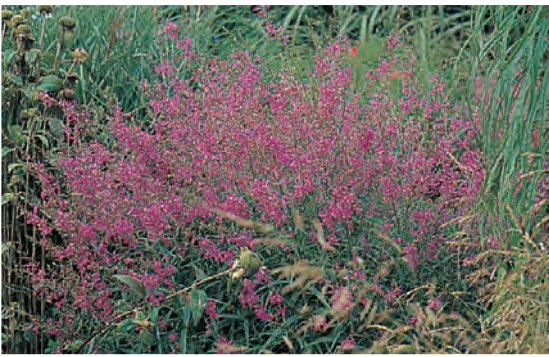
Lythrum virgatum 'Rose Queen' Kattenstaart ○ ● H 75-100 cm B 7-8