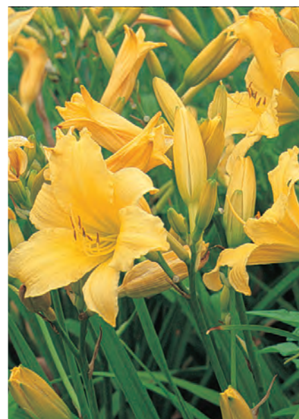
Hemerocallis 'Suzy Wong'