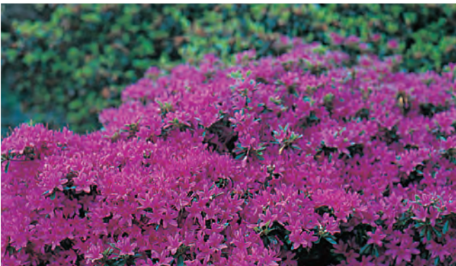
Rhododendron (Japanse azalea) 'Hatsugiri' Japanse azalea ● H tot 3 m B 5-6