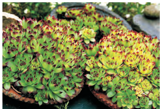
Sempervivum tectorum Gewoon huislook ○ H 10-15 cm B 6-8