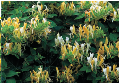
Lonicera japonica 'Hall's Prolific'