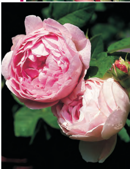
Rosa (David Austin-roses) 'Constance Spry'