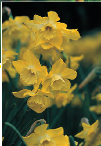
Narcissus (Jonquilla-groep) 'Pipit'