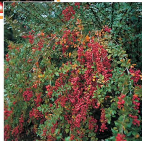
Gaultheria mucronata Parelbos ● H 50-75 cm B 5-6