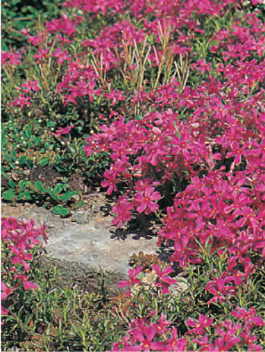
Phlox (Subulata-groep) 'Temiskaming' Vlambloem ○ H 5-10 cm B 4-5