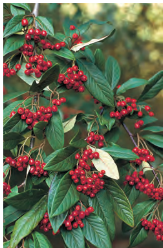
Cotoneaster X watereri 'St Monica' Dwergmispel ○ ● H tot 4 m B 6