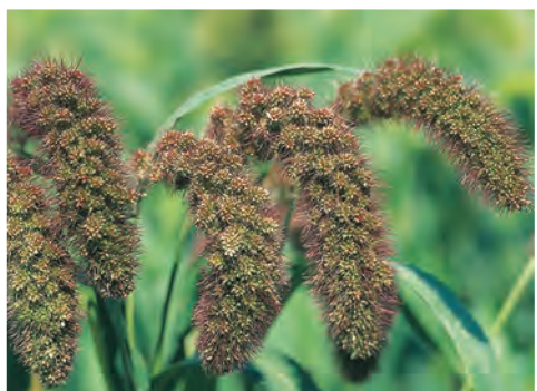
Setaria italica Vogelgiest ○ H 75-100 cm B 7-9