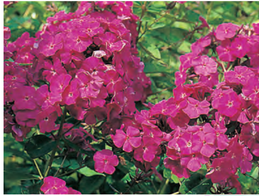
Phlox (Paniculata-groep) 'Vintage Wine' Vlambloem ○ ● H 130-160 cm B 7-8