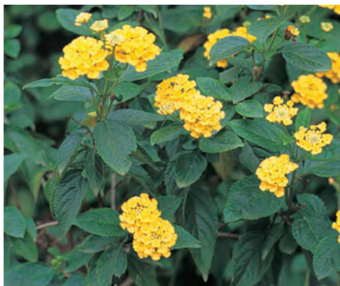
Lantana Camara -groep