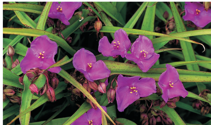
Tradescantia (Andersoniana-groep) 'Joy' Eendagsbloem ● H 50-75 cm B 6-9