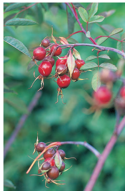
Rosa glauca Roos ○ H tot 3 m B 6-7