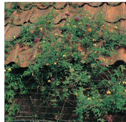
Clematis (Tangutica-groep) 'Aureolin'