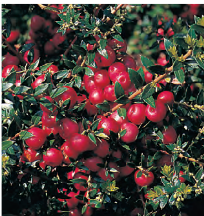
Vaccinium vitis-idaea 'Koralle' Rode bosbes, vossenbes ○ ● H 15-25 cm B 5-6