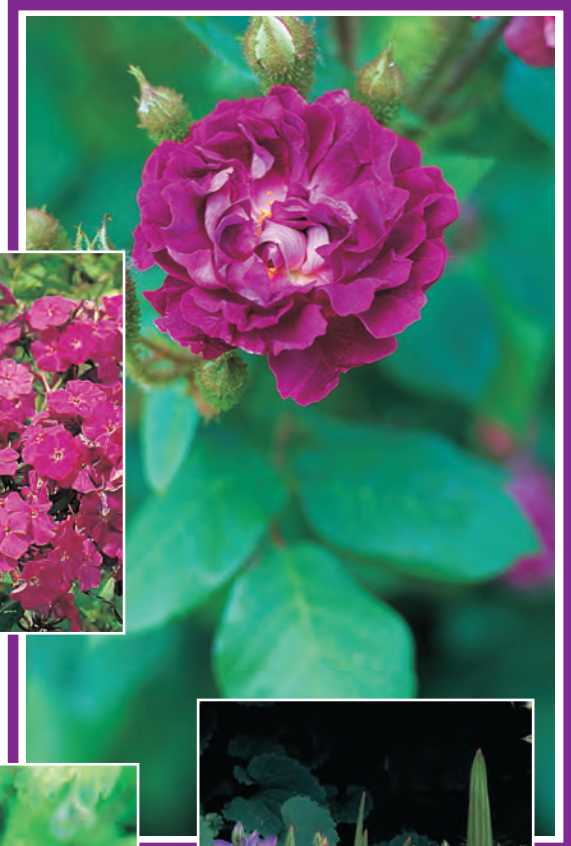
Rosa 'William Lobb' Mosroos ○ H tot 2 m B 6-7