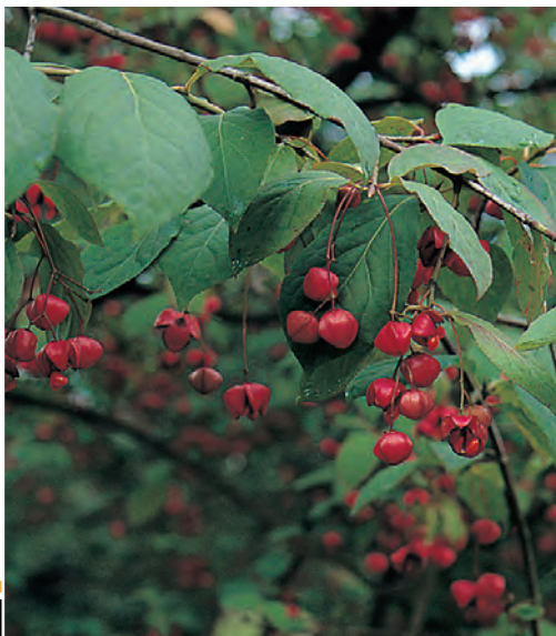
Euonymus planipes Kardinaalshoed ○ ● H tot 5 m B 5