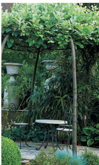
Sorbus aria Meelbes ○ ● H tot 12 m B 5