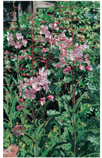
Epilobium angustifolium 'Stahl Rose'