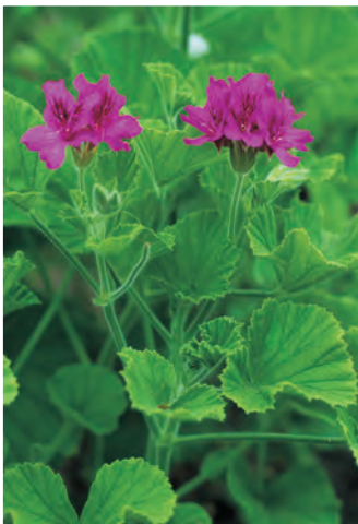
Pelargonium cucullatum ○ H 25-50 cm B 5-10 △