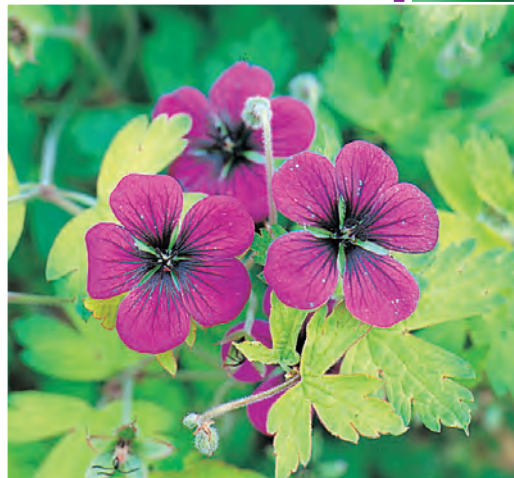
Geranium 'Ann Folkard' Ooievaarsbek ○ ● H 25-50 cm B 6-7