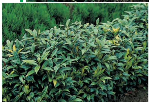
Sarcococca hookeriana var. humilis Zoete buxus ● ● H tot 50 cm B 1-3