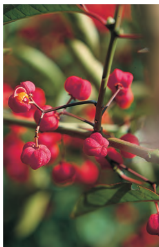
Euonymus hamiltonianus ssp. sieboldianus Kardinaalshoed ○ H tot 3 m B 5-6