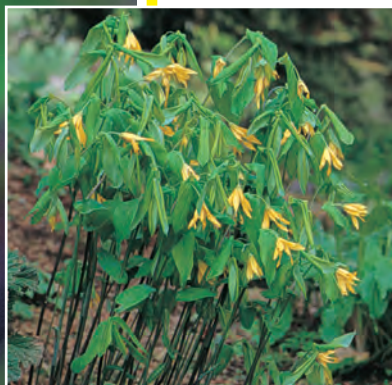
Uvularia grandiflora Treurklokje