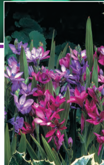
Babiana stricta ○ H 15-25 cm B 3-4 △