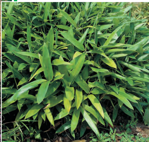
Sasa tsuboiana Dwergbamboe ○ ● H 50-75 cm