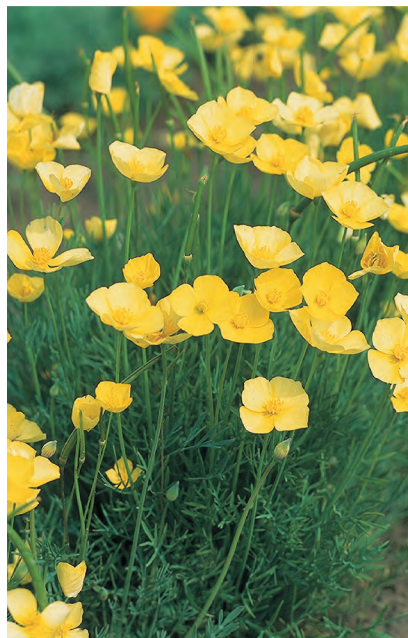
Eschscholzia caespitosa 'Sundew'