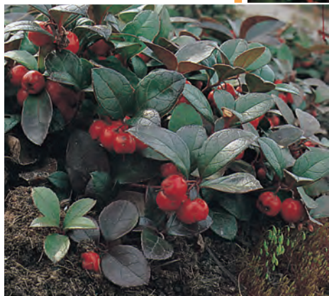
Gaultheria procumbens Bergthee ● ● H 15-20 cm B 7-8