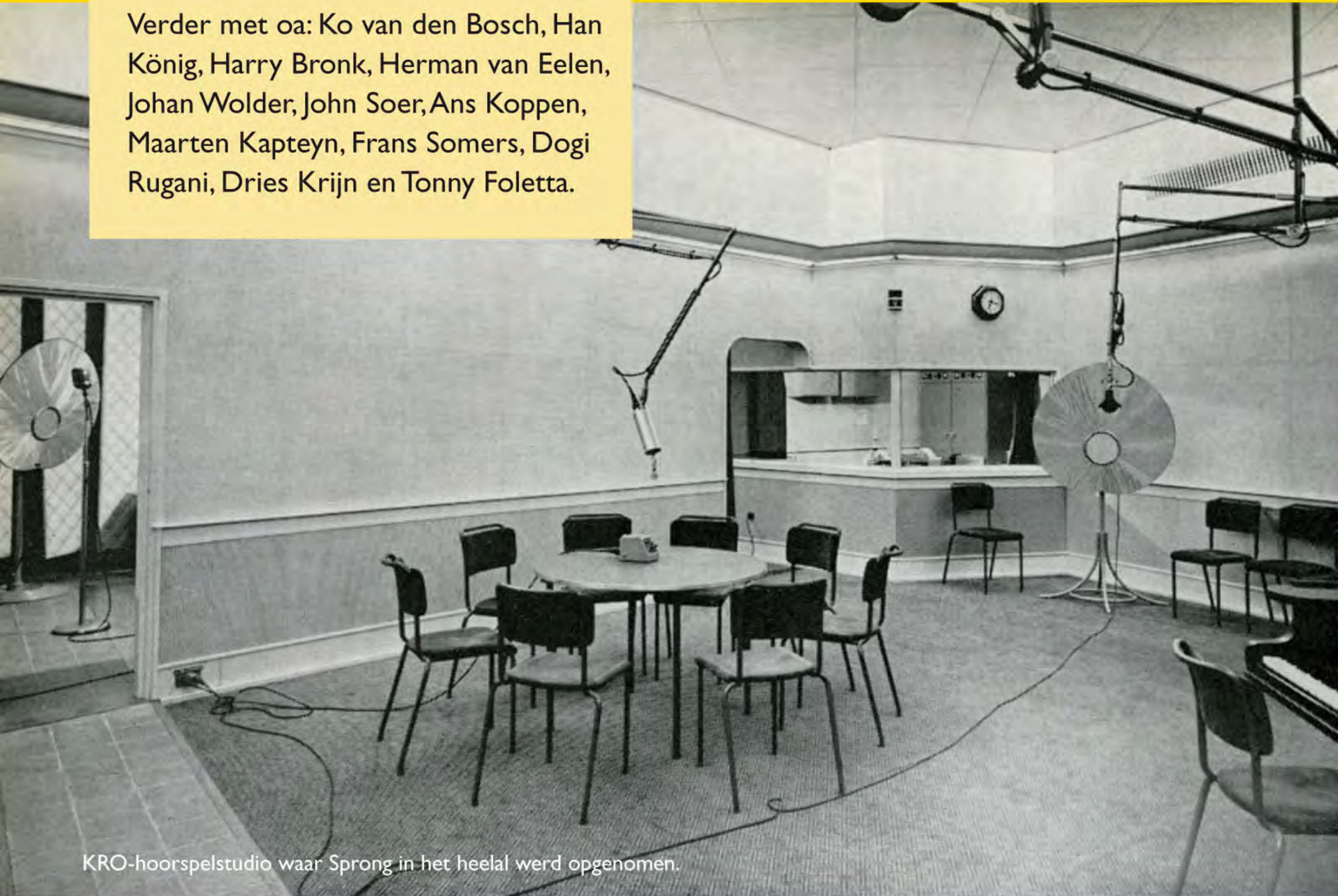
KRO-hoorspelstudio waar Sprong in het heetal werd opgenomen.