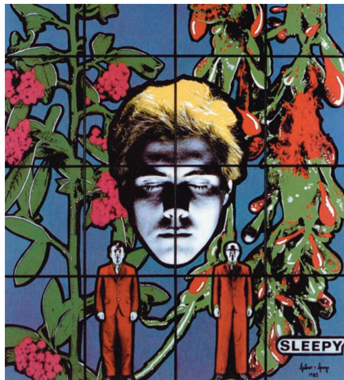
GILBERT AND GEORGE. SLEEPY (1985)