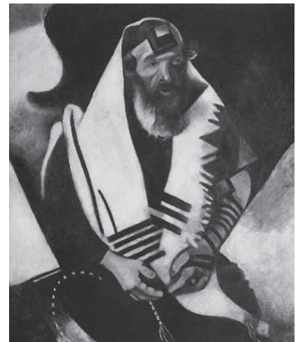
CHAGALL, JOODSE MAN

b. Zoek nu zelf ook nog drie andere Nederlandse woorden van Jiddische oorsprong, plus de betekenis.