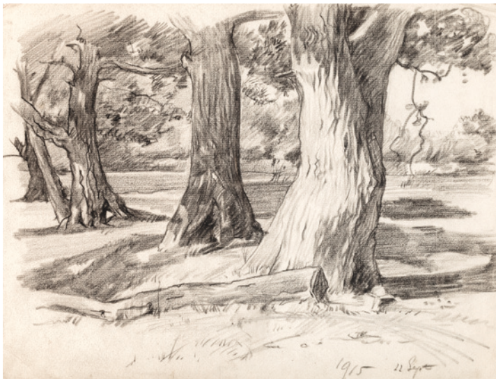
Bomen potlood, september 1915, 235 x 315 mm.