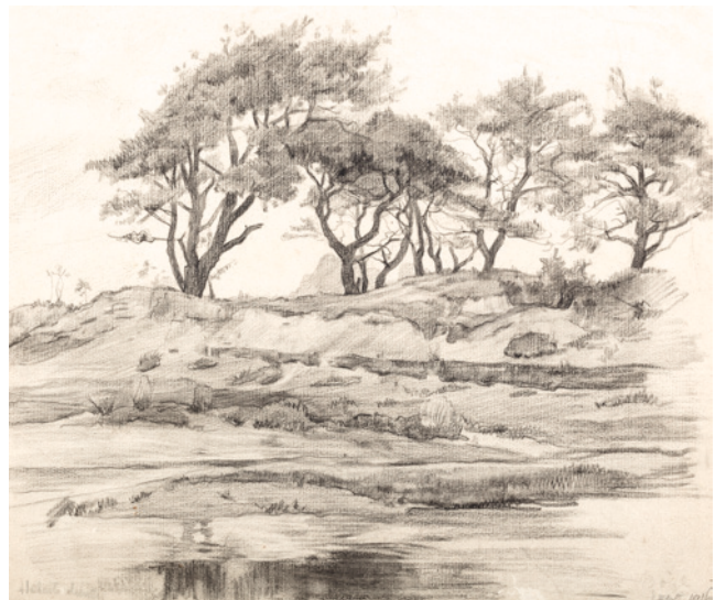
Landschap potlood, september 1916, z.m.