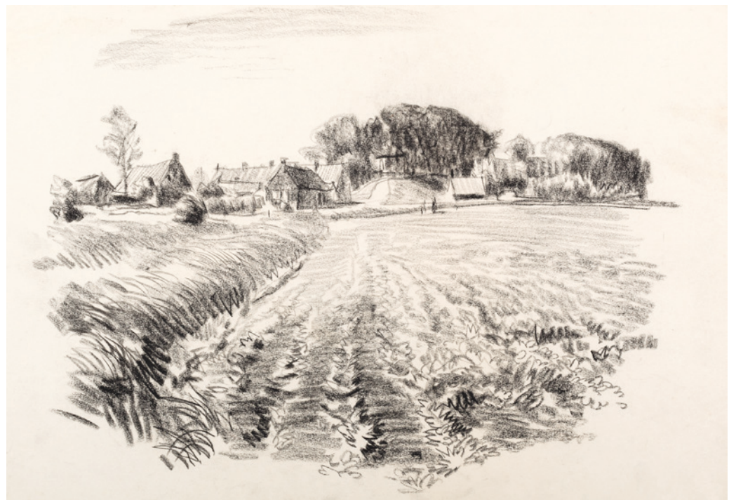
Hogebeintum zwart krijt, z.j., 290 x 380 mm.