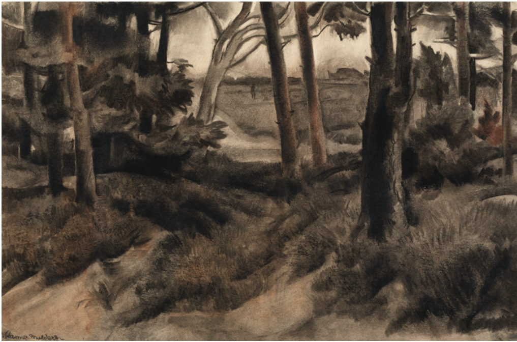
Bos zwart en rood krijt, houtskool, z.j., 450 x 690 mm.