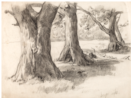
Bomen potlood, september 1916, 228 x 310 mm.