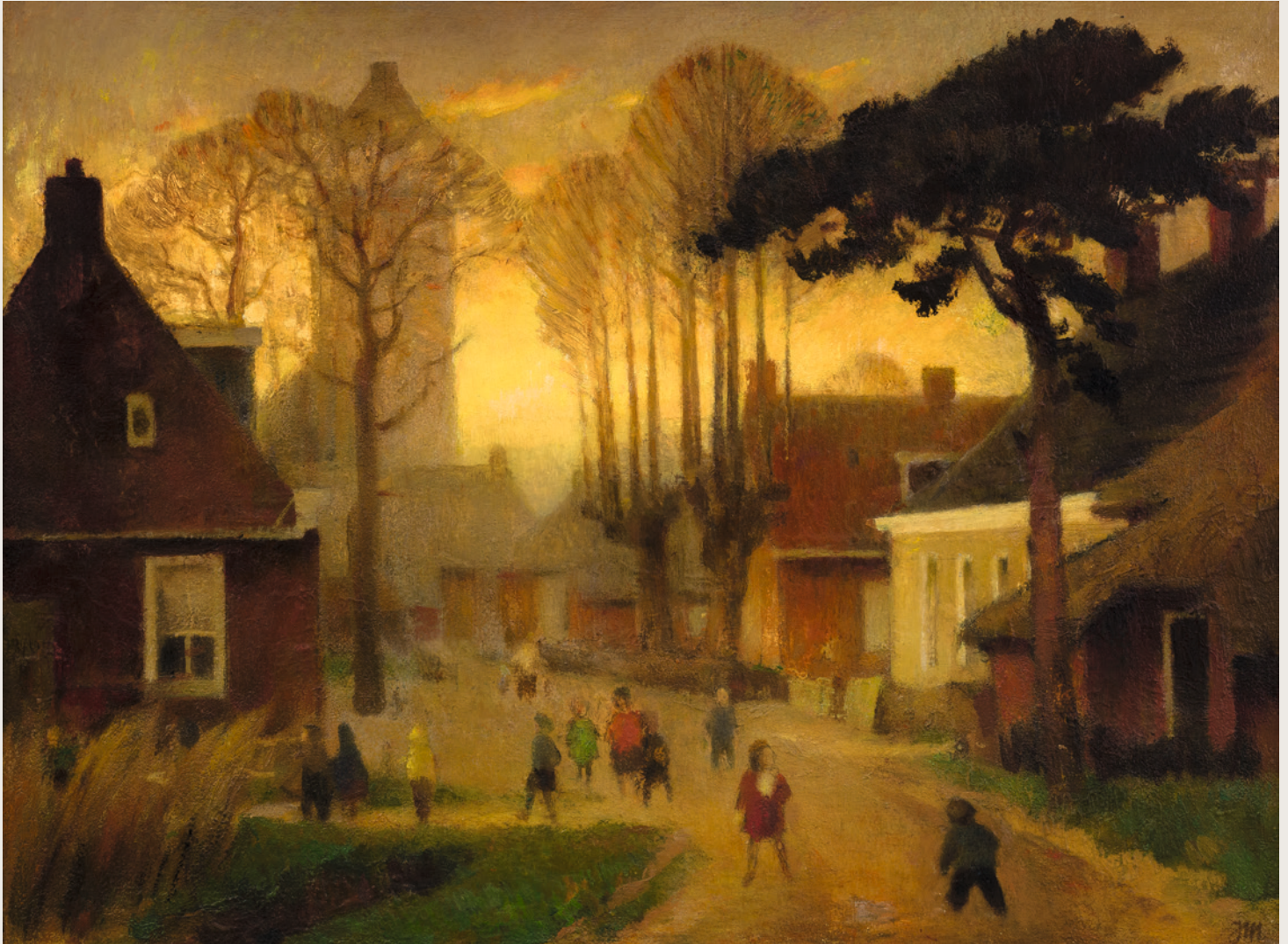
De Hoek Vledder olieverf, 1970, 445 x 669 mm, bruikleen Dorpsarchief Noordwolde.