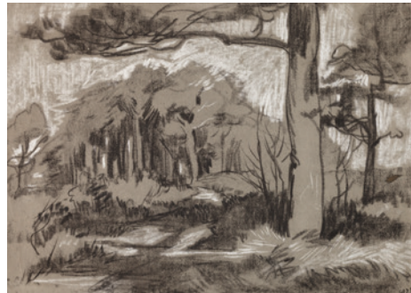
Boslandschap krijt, 1921, 237 x 325 mm.