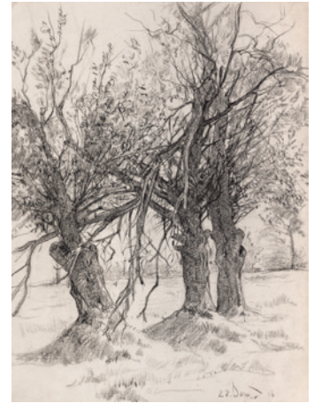
Boom potlood, 1916, 297 x 220 mm.

gelegenheid van diens tachtigste verjaardag. Een tentoonstelling die gehouden zou worden van 27 juli – 3 september 1979 in het Fries Museum onder de titel Johannes Mulders schilderijen, tekeningen en grafiek en van 10 september – 1 oktober 1979 in de expositieruimte van de Openbare Bibliotheek in Wolvega. Laatst genoemde tentoonstelling was iets beperkter in omvang. Er verscheen voor die tijd een fraaie catalogus in kleur van 32 pagina's. Op het omslag alleen onderaan de markante handtekening van Johannes Mulders. Op de affiche werd de tweekleurenlinosnede afgebeeld van Het Rode Dorp uit 1929, die destijds in het Friese tijdschrift De Holder verscheen. 3) Burgemeester mr. Luitzen G. Boelens schreef in het voorwoord dat Mulders zijn hele leven zijn geboortestreek was trouw gebleven: 'Zijn inspiratie putte hij uit deze streek en zijn bevolking, waarvan hij de kenmerkende trekken op onnavolgbare wijze tot uitdrukking wist te brengen.' 4) Bij de uitreiking van de Koninklijke Onderscheiding werden woorden van gelijke strekking gesproken door burgemeester Boelens. Een aantal vrienden van het eerder genoemde comité woonden de plechtigheid bij. 5)