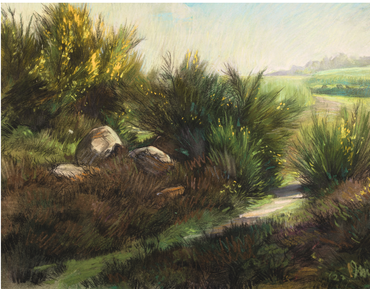
Bremstruiken zwart krijt en pastel, 1922, 387 x 494 mm.