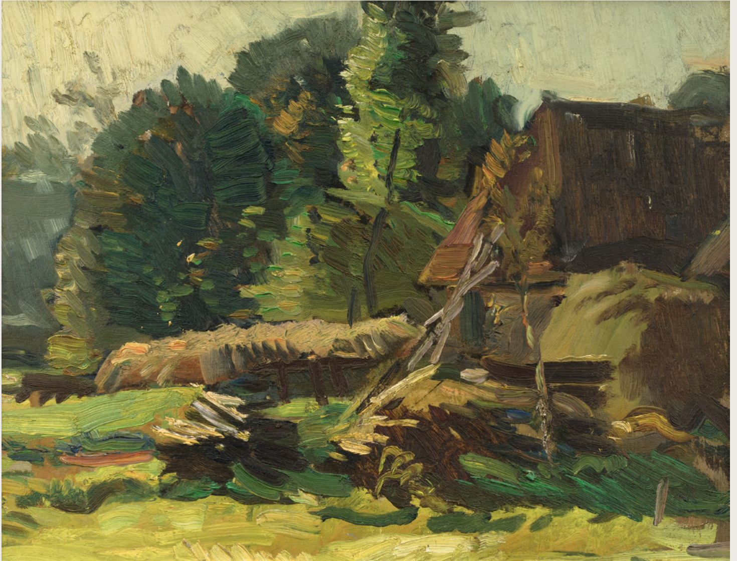
Zonder titel olieverf, z.j., 335 x 435 mm.