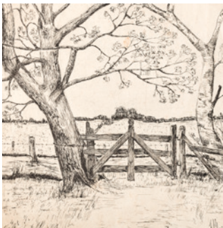
Bomen en hek inkt, z.j., 163 x 166 mm.