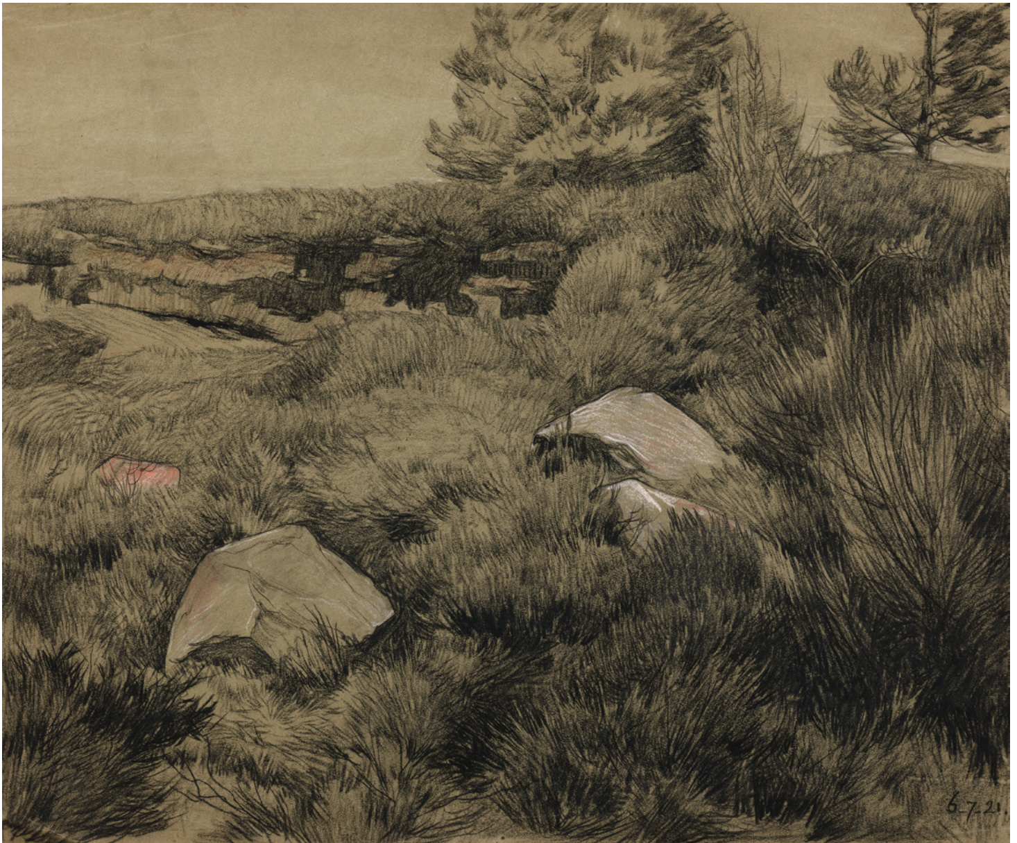
Landschap met zwerfkeien zwart krijt, 6 juli 1921, 460 x 550 mm.