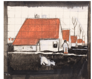
Het Rode Dorp ontwerptekening voor lino, 1929, 120 x 123 mm.

3. De Holder , 4e jr. no. 5, pag. 75 (1929).