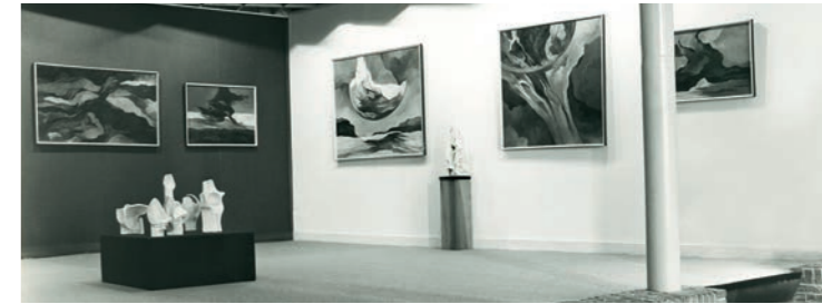
Tentoonstelling Prinsessehof te Leeuwarden, oktober 1961