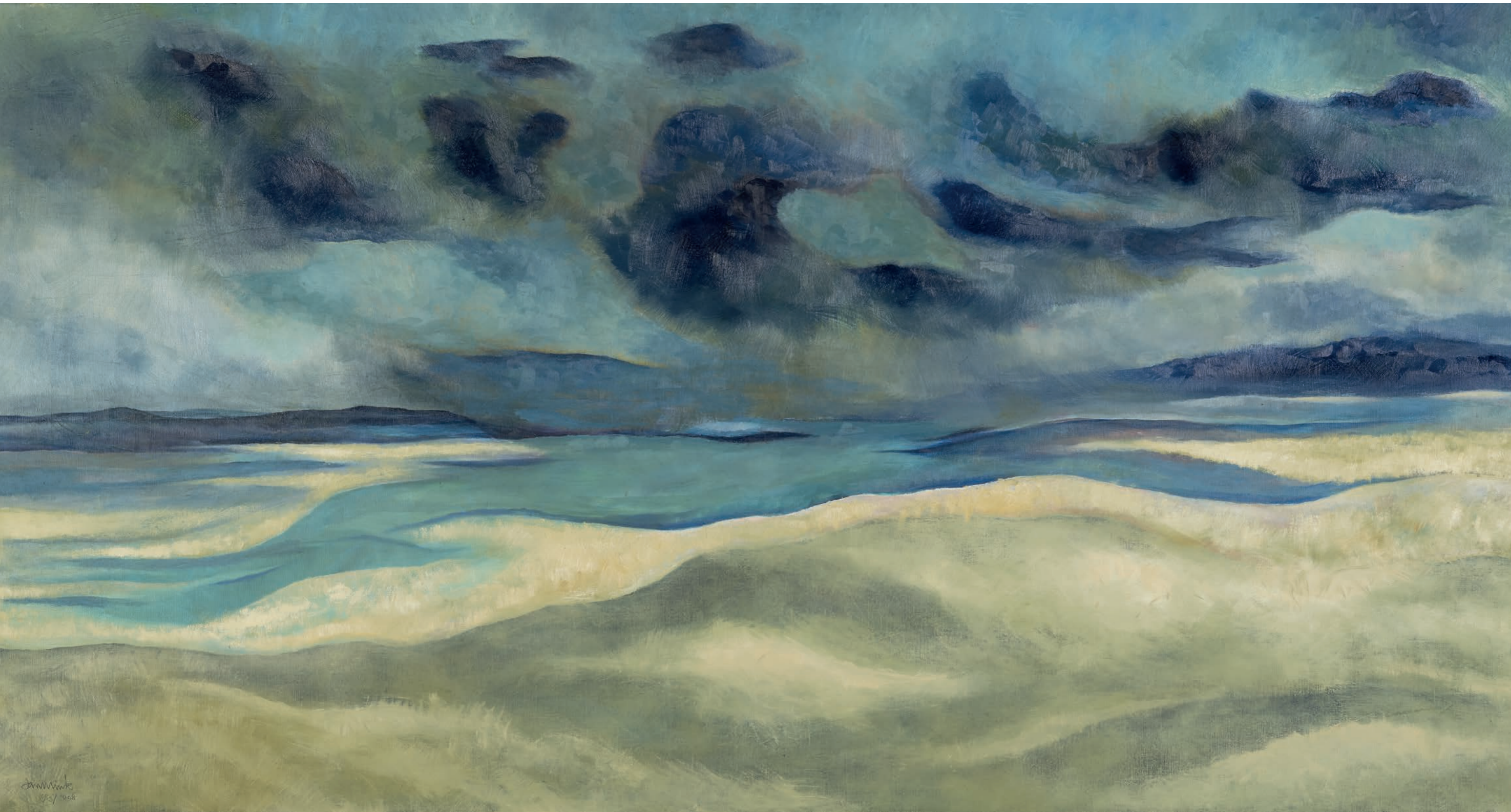
Oneindige beweging – Boschplaat 1987/2008 Olieverf op doek, 100 x 200