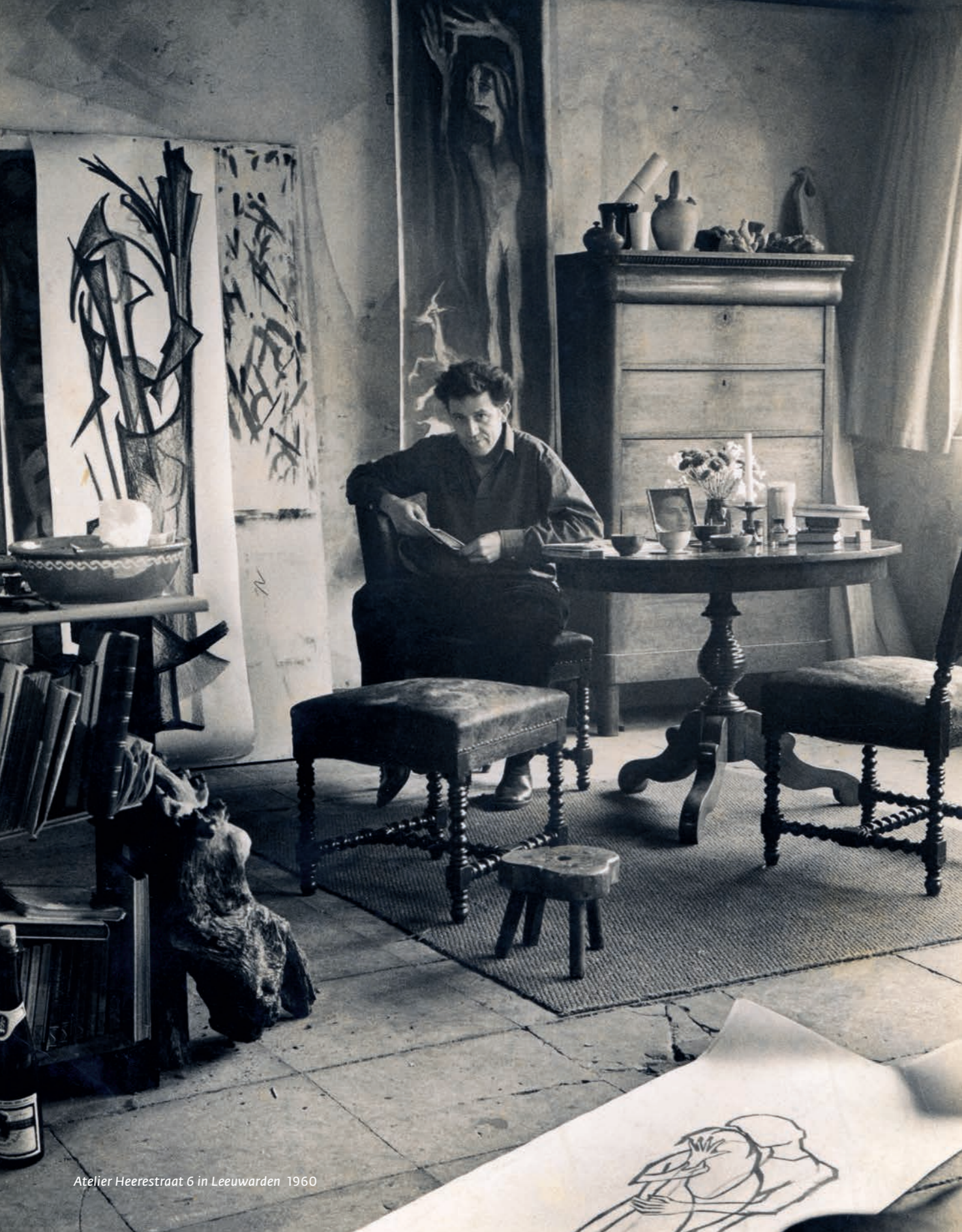
Atelier Heerestraat 6 in Leeuwarden 1960