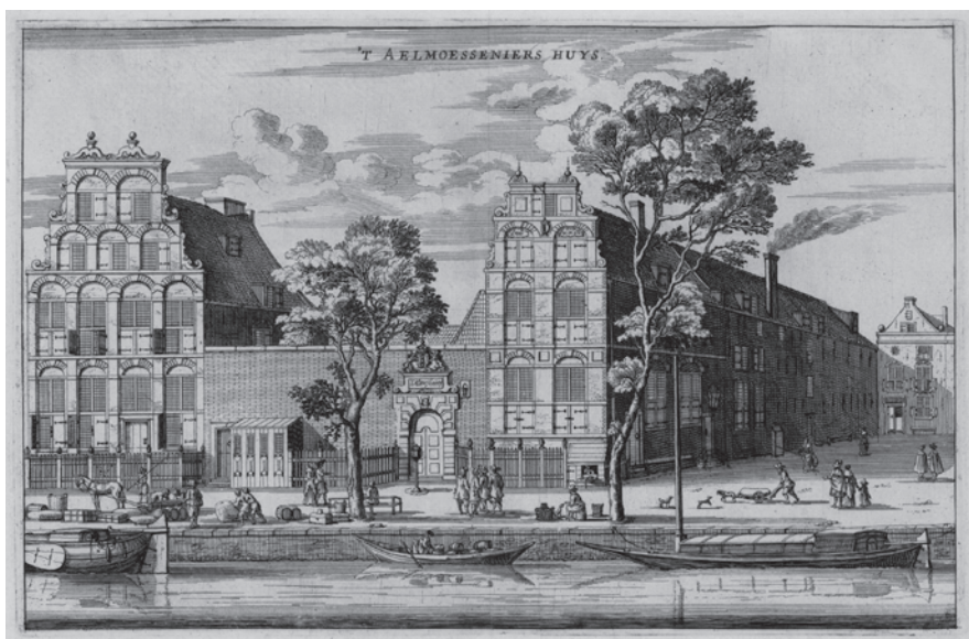
Twee vroegmoderne strafinrichtingen: Het rasphuis uit 1596 aan de Heiligenweg 1663, anoniem Het Aalmoezeniershuis uit 1613 aan het Singel ± 1660, anoniem