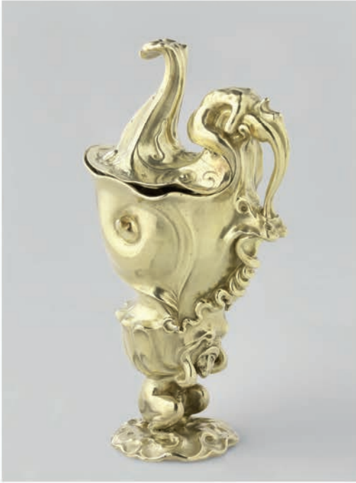
3 Adam van Vianen, Kan met deksel, Utrecht 1614, verguld zilver, h. 25 cm. Rijksmuseum, Amsterdam (BK-1976-75)

Toch blijken er wel indicaties te zijn over de oorspronkelijke benaming van deze nieuwe stijlontwikkeling. Toen omstreeks 1650 prentenseries werden uitgegeven met voorbeelden van dergelijke ornamenten, kregen sommige hiervan titels als ‘Nieuwe’ of ‘Constige Vindingen’, maar ook werden ze wel als ‘Snakerijen’ aangeduid (afb. 2). 3 Dit wijst erop dat men er een nieuwe uiting van artistieke creativiteit in bespeurde, die gekenmerkt werd door speelsheid en frivoliteit. De zojuist genoemde term werd ook al opgemerkt door de Duitse kunstenaar Joachim von Sandrart, toen hij omstreeks 1640 in Amsterdam verbleef. In zijn in 1675 gepubliceerde boek Teutsche Academie met biografieën van een groot aantal kunstenaars beschrijft hij een van de meest uitbundige voorbeelden van kwabornamentiek: de zilveren kan, die de Utrechtse zilversmid Adam van Vianen in 1614 gemaakt heeft voor het Amsterdamse goud- en zilversmedengilde als herinnering aan zijn in Praag overleden broer Paulus van Vianen (afb. 3). 4 Alles aan