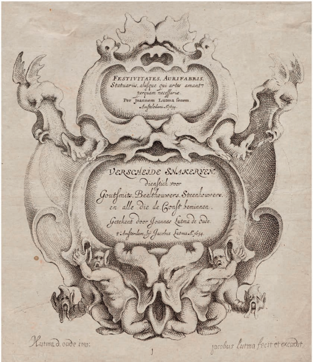
2 Jacob Lutma naar Johannes Lutma sr., Titelprint van de serie 'Verscheide Snakerijen', 1654, ets en gravure, 217 x 185 mm. Fries Museum, Leeuwarden; bruikleen Ottema-Kingma Stichting (NO 20034)