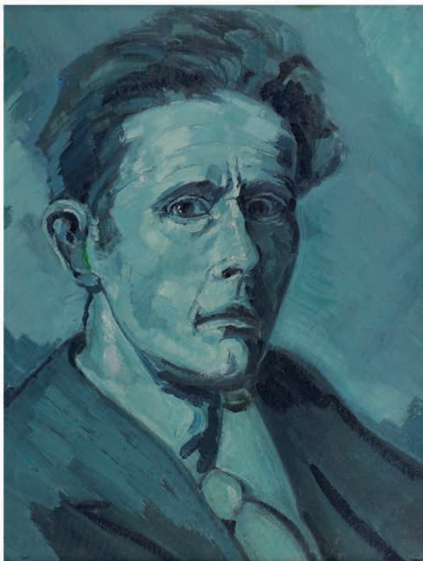
Zelfportret, collectie Ottema-Kingma Stichting