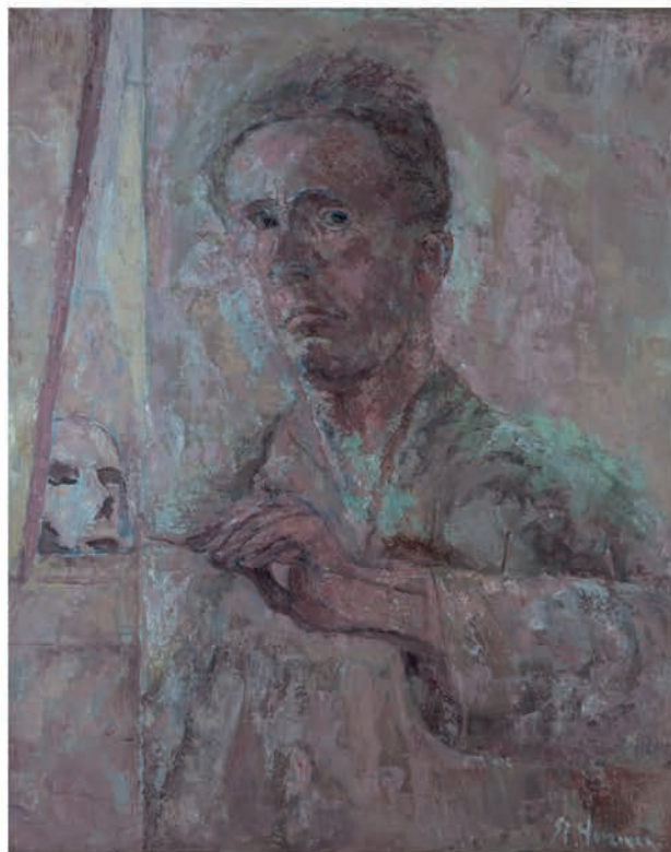
Zelfportret, particuliere collectie

In 1952 treden ze als Yn 'e line naar buiten als ze als groep exposeren in De Mangelgang in Groningen. De naam verwijst naar een allang in onbruik geraakte praktijk uit het vrachtvervoer over water. Op de Friese meren kon een schip vaart maken door te zeilen, maar in de kanalen en vaarten was de schipper aangewezen op spierkracht. Dat wil zeggen: de spierkracht van zijn vrouw en kinderen. Terwijl de schipper aan het roer