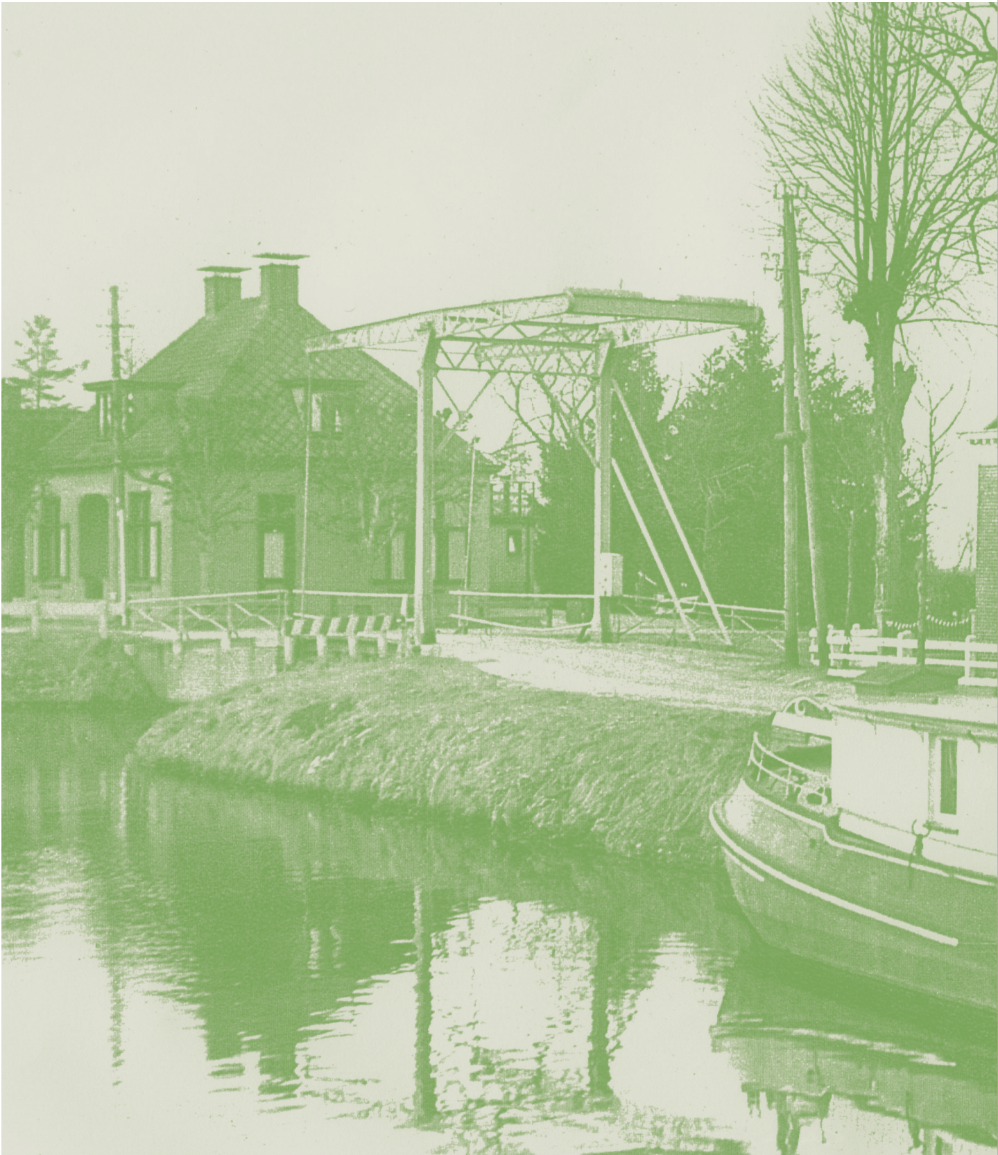
Klapbrug over de Eerste Wijk, omstreeks 1943. De brug is in 1974 vervangen door een dam.