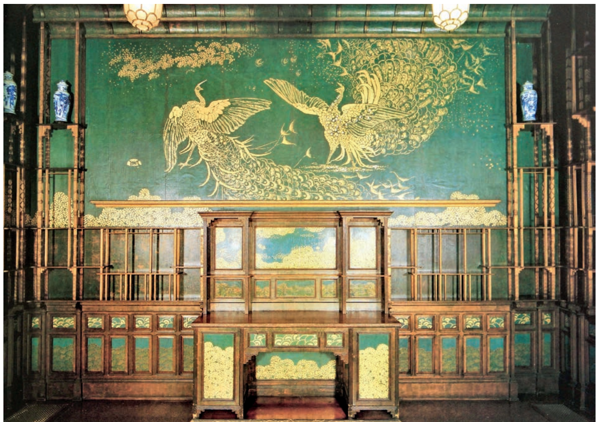
James McNeill Whistler, The Peacock Room, 1876-1877