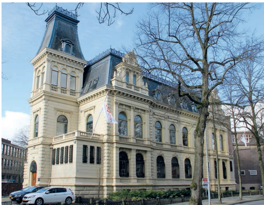
1. Groningen, Hereplein. G. Schnitger, 1881