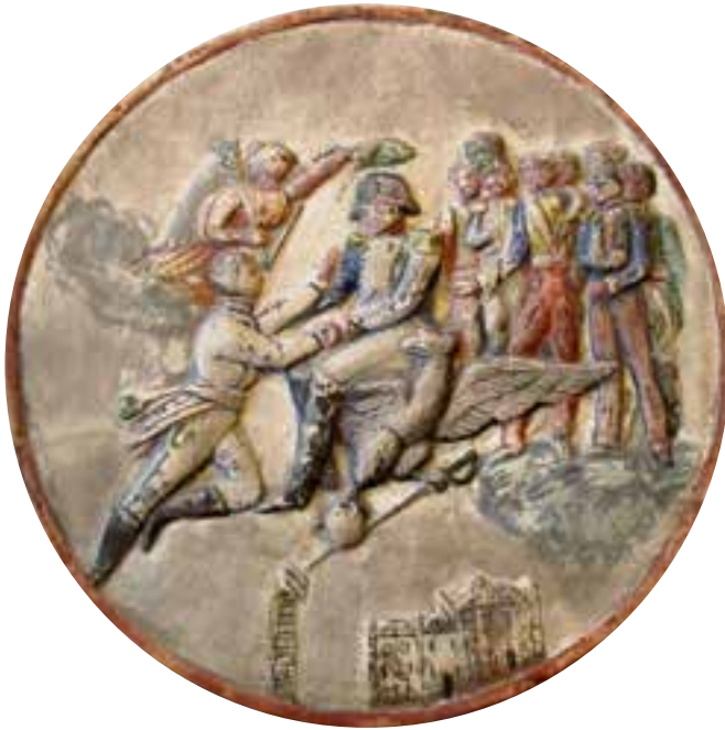
02 Patacon (aardewerken sierschijf die op brood gelegd werd tijdens de Kerst-en Nieuwjaarstijd) met daarop een voorstelling van Napoleon, zittend op een adelaar, die zijn zoon, de koning van Rome, in de hemel ontvangt (ontstaan tussen 1850-1950).