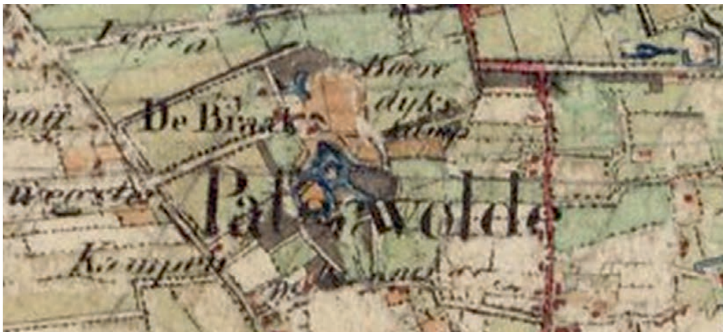
De Braak rond 1850 (Topografische Militaire Kaart 1853)

Zichtbaar zijn de formele aanleg van De Braak en de landschapsparken van de landgoederen Noordwijk, Vennebroek, Brinkhoven en Lemferdinge. De vroege landschappelijke aanleg rondom De Braak kan met behulp van deze kaart gekoppeld worden aan de verschillende opdrachtgevers en eigenaren en hun onderlinge familieverbanden. 3