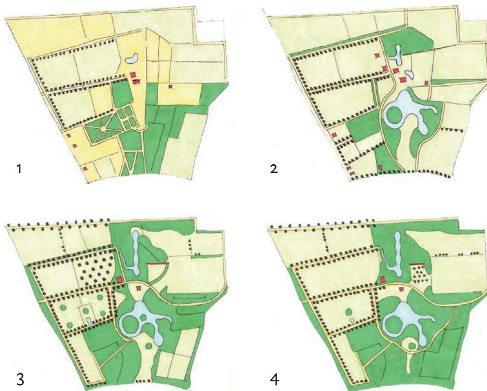
Schematische weergave van de verschillende perioden, 1. achttiende-eeuwse formele aanleg, 2. de negentiende-eeuwse landschappelijke aanleg, 3. de begin twintigste-eeuwse aanleg en 4. de aanleg rond 1930