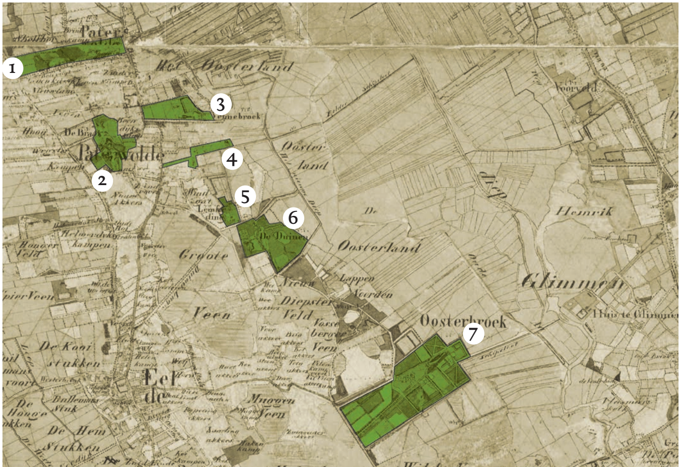
Topografische Militaire Kaart 1850-1864, met hierop aangegeven de landgoederen: Noordwijk (1), De Braak (2), Vennebroek (3), Brinkhoven (4), Lemferdinge (5), De Duinen (6), Oosterbroek (7)