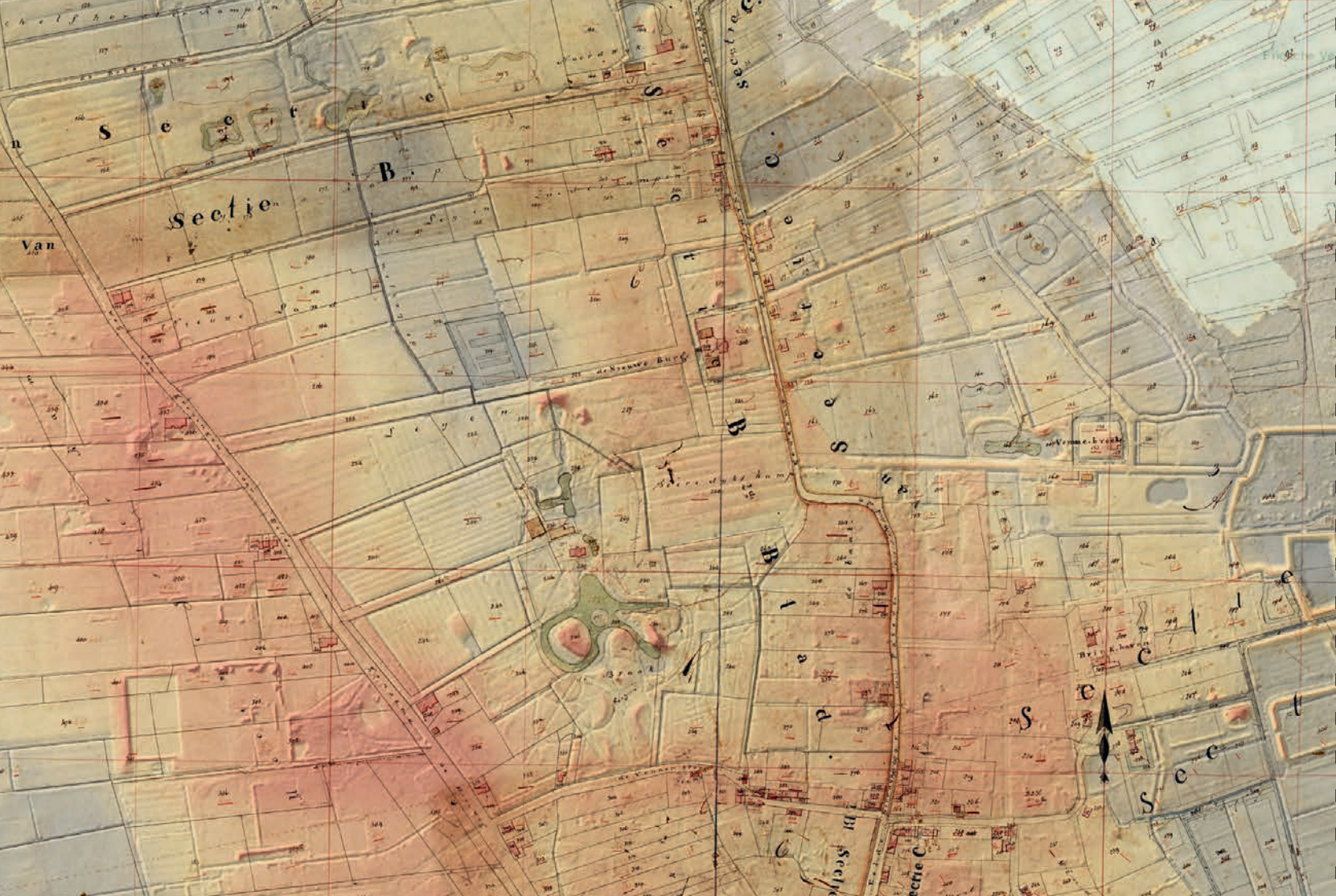
De landschappelijke aanleg van de parken van Eelde-Paterswolde omstreeks 1830 (Kadastraal Minuutplan, verkend in 1827, bewerking door NO.ORDPEIL)

Ten noorden van De Braak ligt het landgoed Noordwijk, waarvan bekend is dat van 1808 tot 1812 de Duitse hovenier Arnoldus Helmantel (1755-1822) er werkzaam was. 6 Adriaan Joseph Trip (1755-1833) had Noordwijk vanaf 1794 in eigendom en woonde na zijn tweede huwelijk in 1797 met Sibilla Catharina Sichterman op dit landgoed. 7 Door zijn eerste huwelijk in 1776 met Theodora Hinriëtta baronesse von Rheden (1745-1780) werd hij de zwager van Henri de Sandra Veltman, eigenaar van de Fraeylemborg in Slochteren. Trip werd blijkbaar geïnspireerd door zijn zwager, die al vanaf 1780 bezig was met de landschappelijke aanleg rond deze borg. 8 Hij liet het Slochterbos, het noordelijke deel van het park bij de borg, tussen 1805 en 1810 ontwerpen en aanleggen door de Zwolse tuinarchitect Georg Anton Blum (1765-1827). 9 Het resulteerde in een van de meest omvangrijke landschapsparken uit het vroege begin van de negentiende eeuw van Noord-Nederland. 10 Of de uit Duitsland afkomstige Blum ook samenwerkte met zijn landgenoot Helmantel bij de aanleg van Noordwijk is niet bekend.