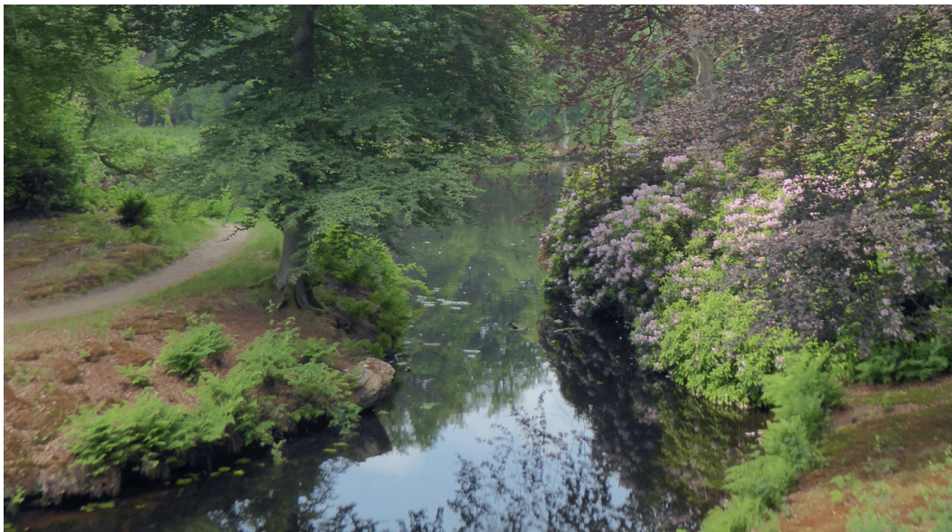
Een deel van de Grote Vijver als meanderende rivier, 2020