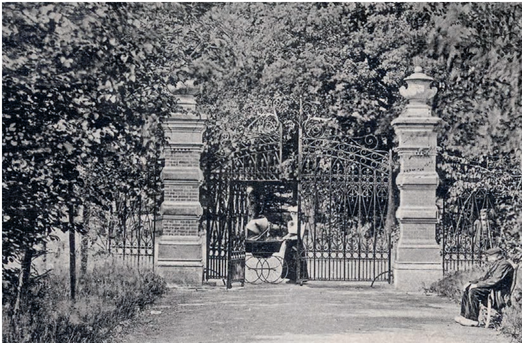
De hoofdentree van De Braak bij de Hoofdweg omstreeks 1900 met het smeedijzeren hekwerk uit 1856

Blijkbaar voldeed de smalle Vennersteeg niet als hoofdentree van De Braak. Dankzij een overeenkomst met de eigenaar van de grond, de heer Gasinjet van landgoed Vennebroek, kon in 1849 een smal pad worden aangelegd naar de westelijk gelegen Hoofdweg, waaraan ook Vennebroek en Noordwijk lagen. 26 In 1854 breidde de oude Hesselink zijn landgoed nog verder uit door de aankoop van het 18 hectare grote landgoed Huis Paterswolde. 27 Daarmee werd de familie Hesselink eigenaar van drie aaneengelegene landgoederen. In 1856, twee jaar voor zijn overlijden, kocht Hesselink grond aan om een officiële oostelijke toegang te maken. Om deze te markeren, werd bij de Hoofdweg een monumentaal hekwerk geplaatst. Uit raadsverslagen en verschillende stukken van de