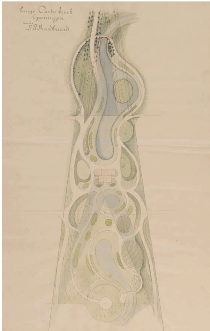
Ontwerptekening van Huize Oosterbroek, getekend door L.A. Springer naar het voorbeeld van L.P. Roodbaard (Speciale collecties Wageningen Universiteit)