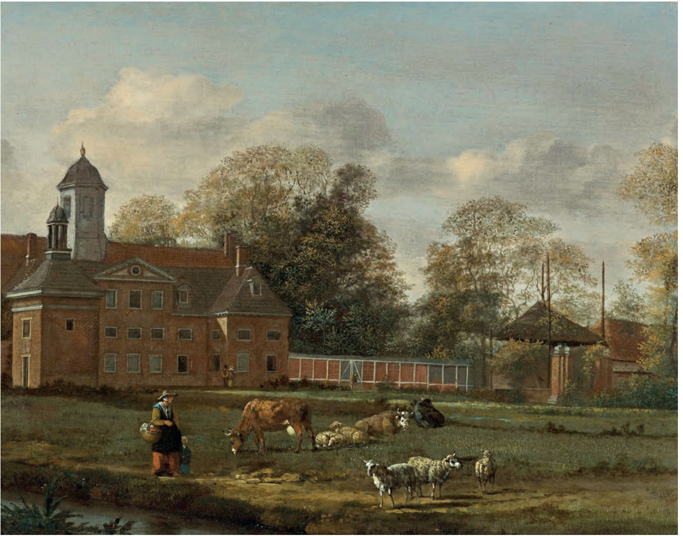
Gezicht op buitenplaats Goudestein aan de Vecht bij Maarssen, tweede helft van de zeventiende eeuw. Misschien wel de meest bekende verbeelding van de verweving tussen landbouw en buitenleven die zo typerend was voor de Hollandse buitenplaatscultuur van de zeventiende en achttiende eeuw.