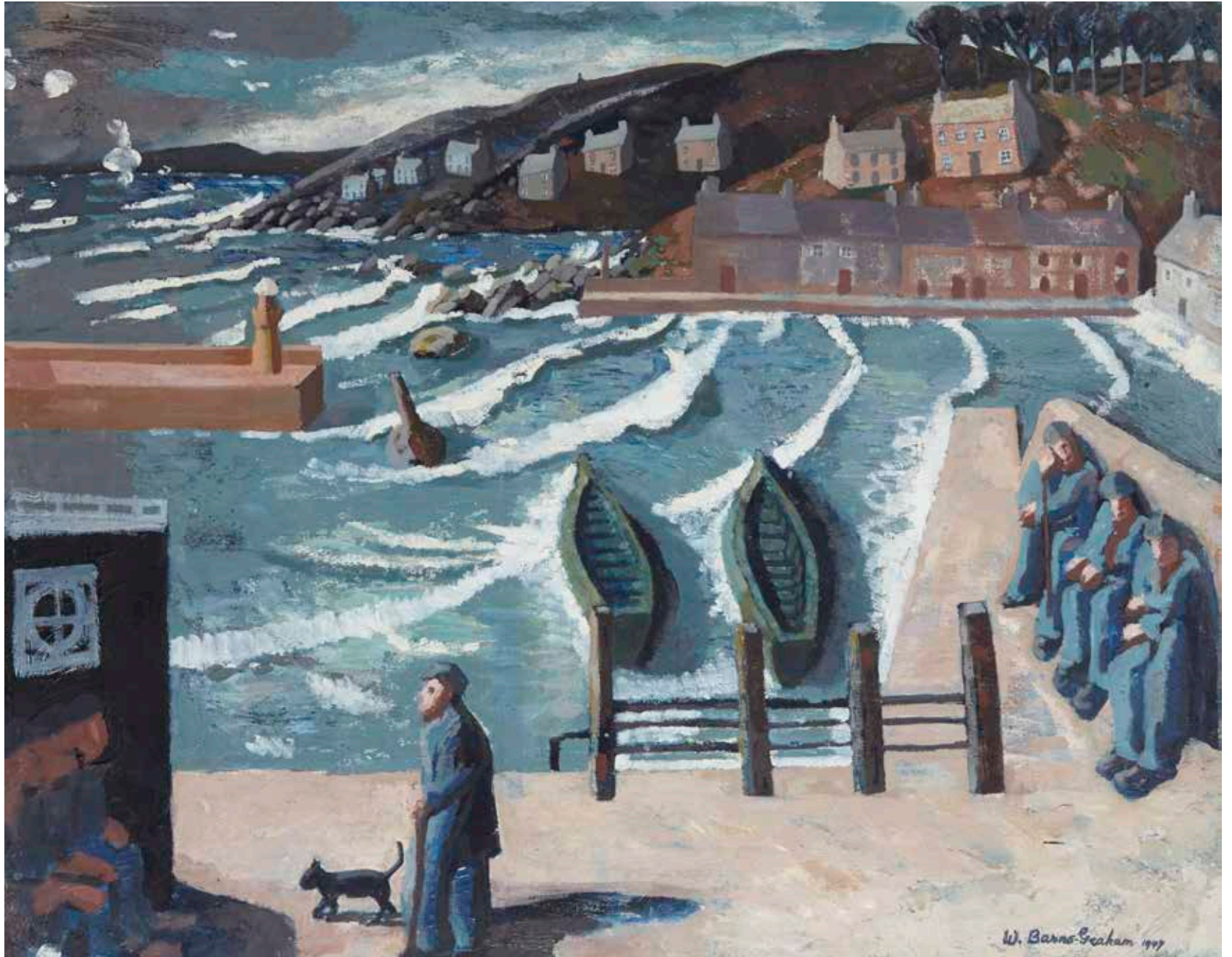
Wilhelmina Barns-Graham (1912-2004) Haventaferreel | Harbour Scene, 1947 olieverf op board | oil on board, 60.4 x 76 cm Wilhelmina Barns-Graham Trust