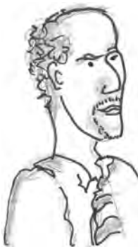
Dit is de Bob

Geen gevloek van leerlingen, boos omdat ze hun telefoontje moesten afgeven, geen klas die joelend over de gang gaat omdat ze een uur eerder uit zijn en bovenal geen bel die het ritme van de lessen dwingend oplegt.