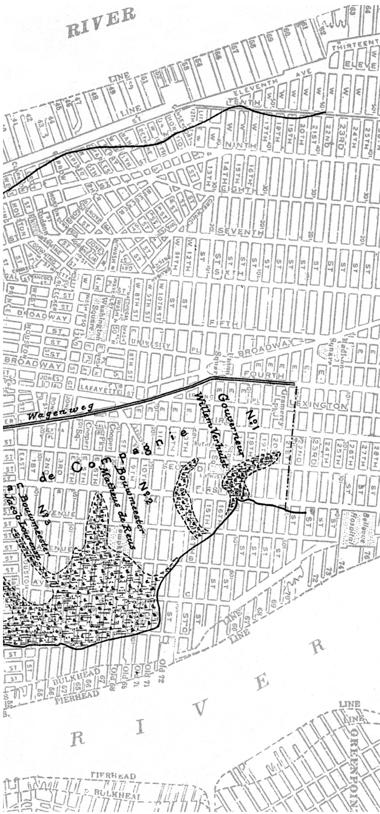
Plaat 2 De oorspronkelijke aanleg van New York uitgevoerd door Crijn Fredericksz in 1625.