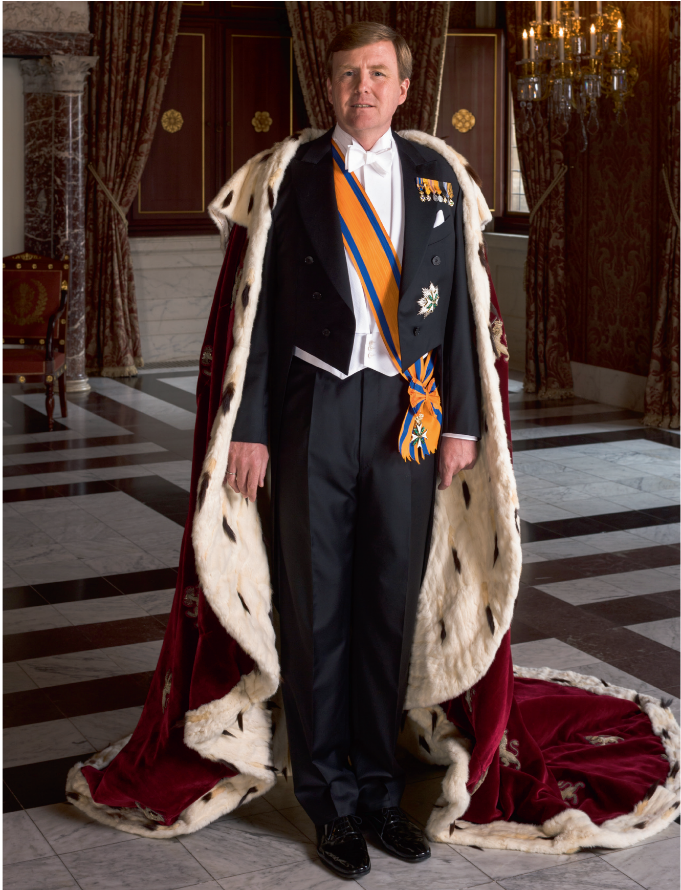
Staatsieportret van koning Willem-Alexander met koningsmantel.