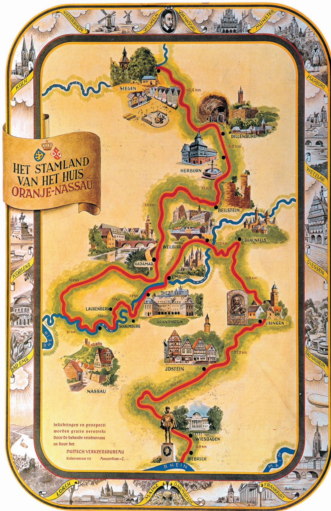
| Kaart van het stamgebied van het geslacht Nassau. Het Duitse verkeersbureau gaf de kaart halverwege de jaren dertig in Nederland uit in verband met verloving en huwelijk van Juliana en Bernhard en het 40-jarige regeringsjubileum van Wilhelmina.