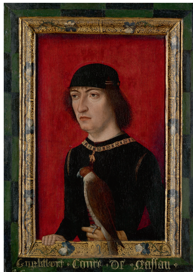
Engelbrecht II, graaf van Nassau, door 'de Meester der Vorstenportretten', 1487. | Rijksmuseum, Amsterdam

De Nederlandse Nassaus speelden echter wel een