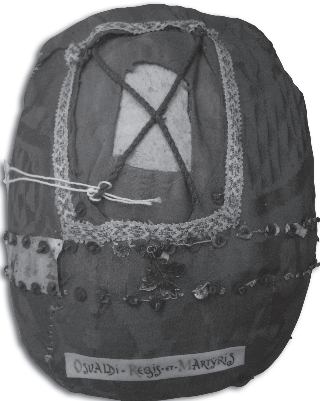
[4] Schedelrelik van Oswald, Museum Catharijneconvent Utrecht, inv.nr. OKM v48