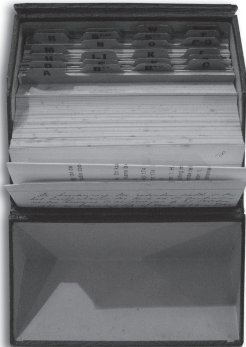
[3] Kaartenbak geopend