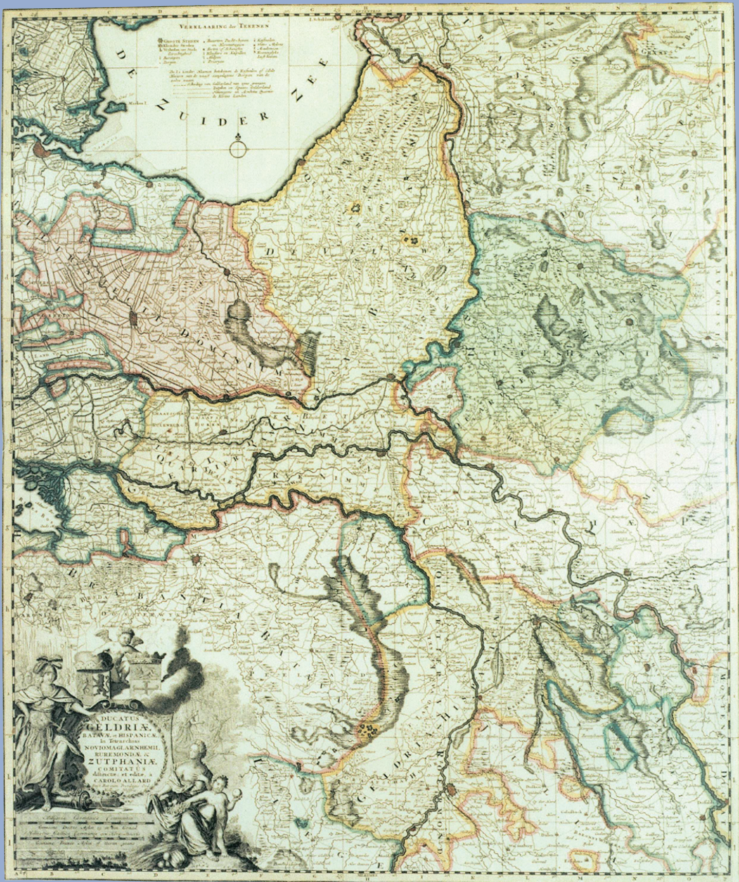
Kaart van het hertogdom Gelre met de vier Kwartieren Nijmegen, Arnhem, Roermond en Zutphen, rond 1600. (Historischer Verein für Geldern und Umgegend, Geldern)