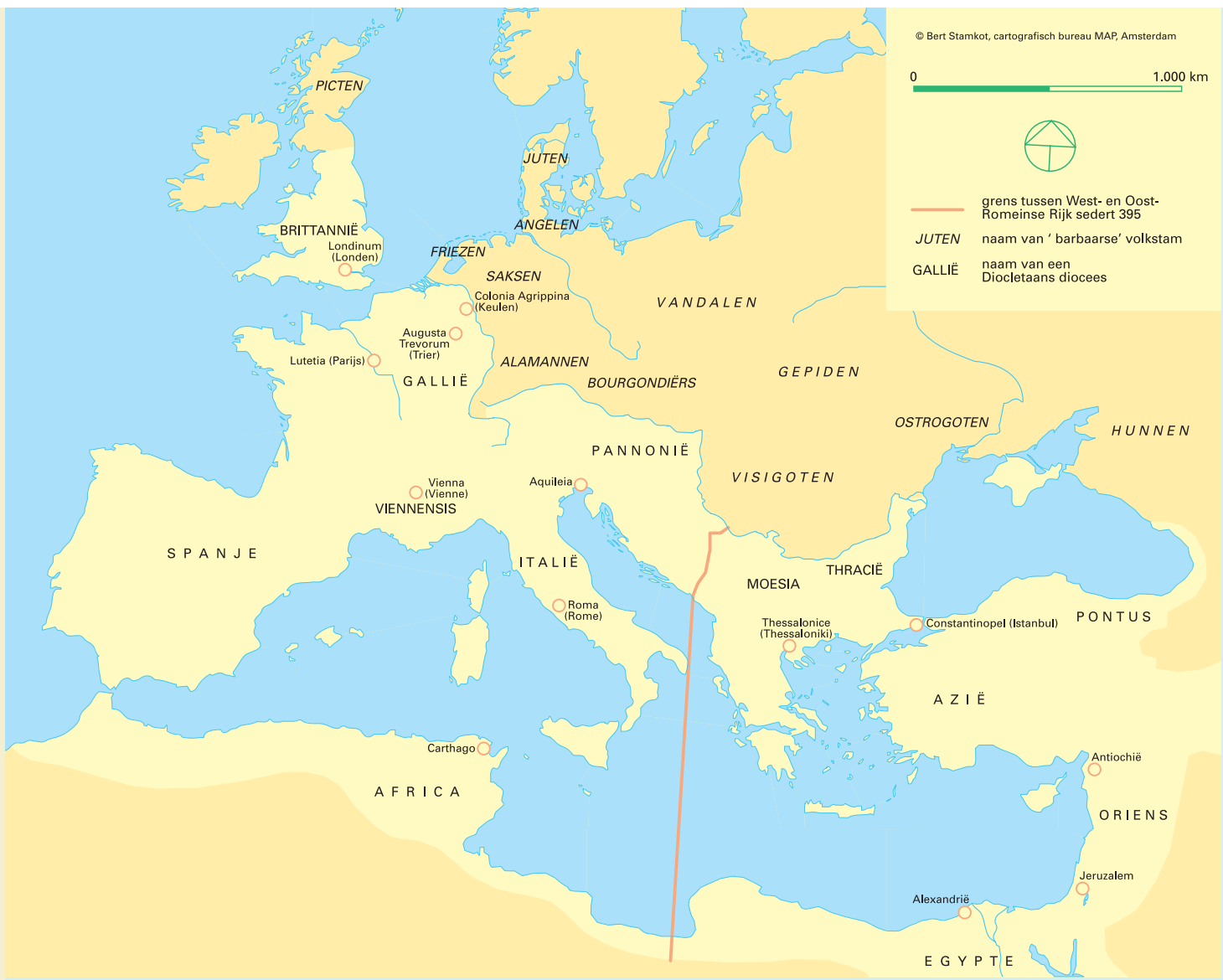
Romeinse Rijk ca. 395.