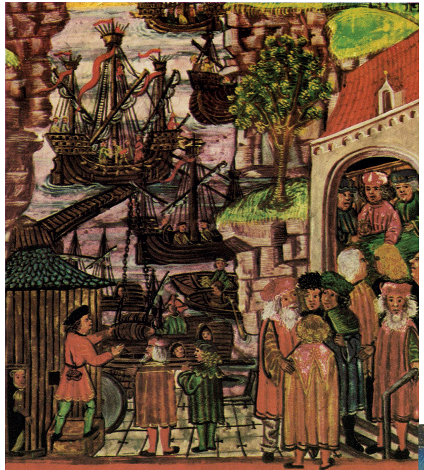
Miniatuur van de haven van Hamburg.

Deze stiefmoederlijke behandeling van de geschiedenis van het graafschap, later hertogdom, Gelre is des te merkwaardiger omdat het gewest zo'n boeiend verleden