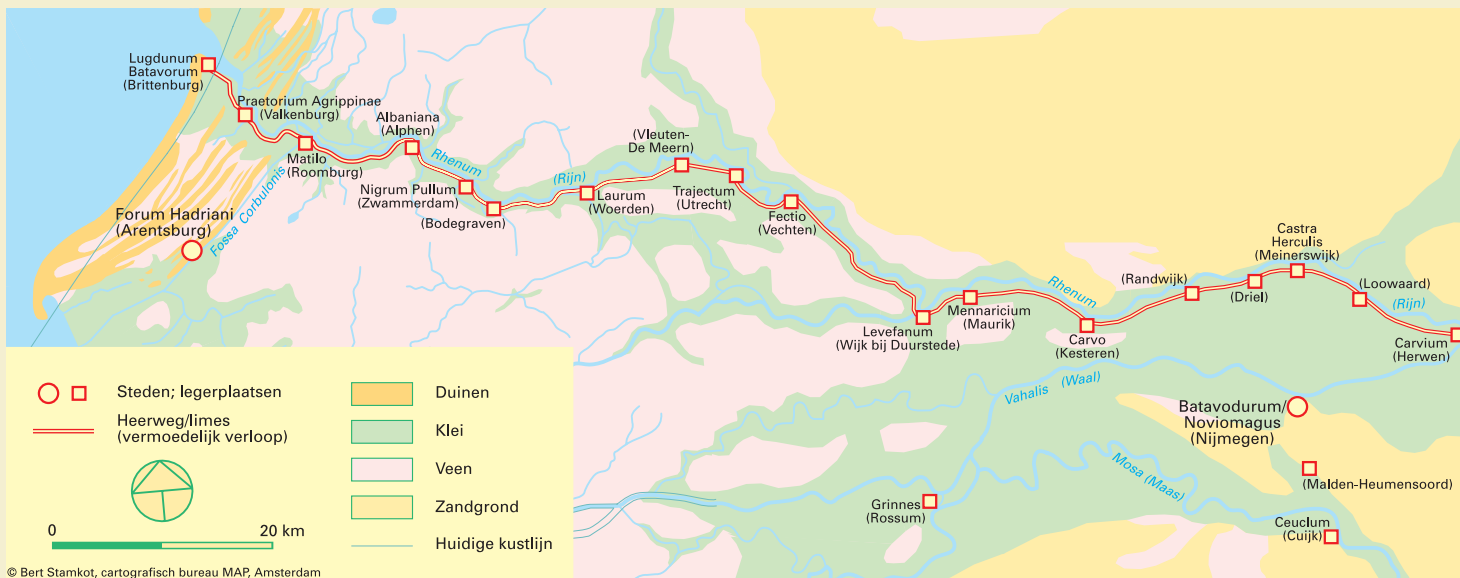
De vermoedelijke legerplaatsen langs de Romeinse Rijksgrens, de Limes.