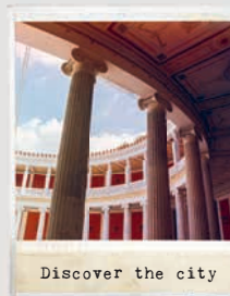
Discover the city