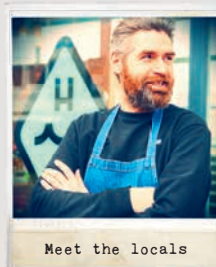
Meet the locals