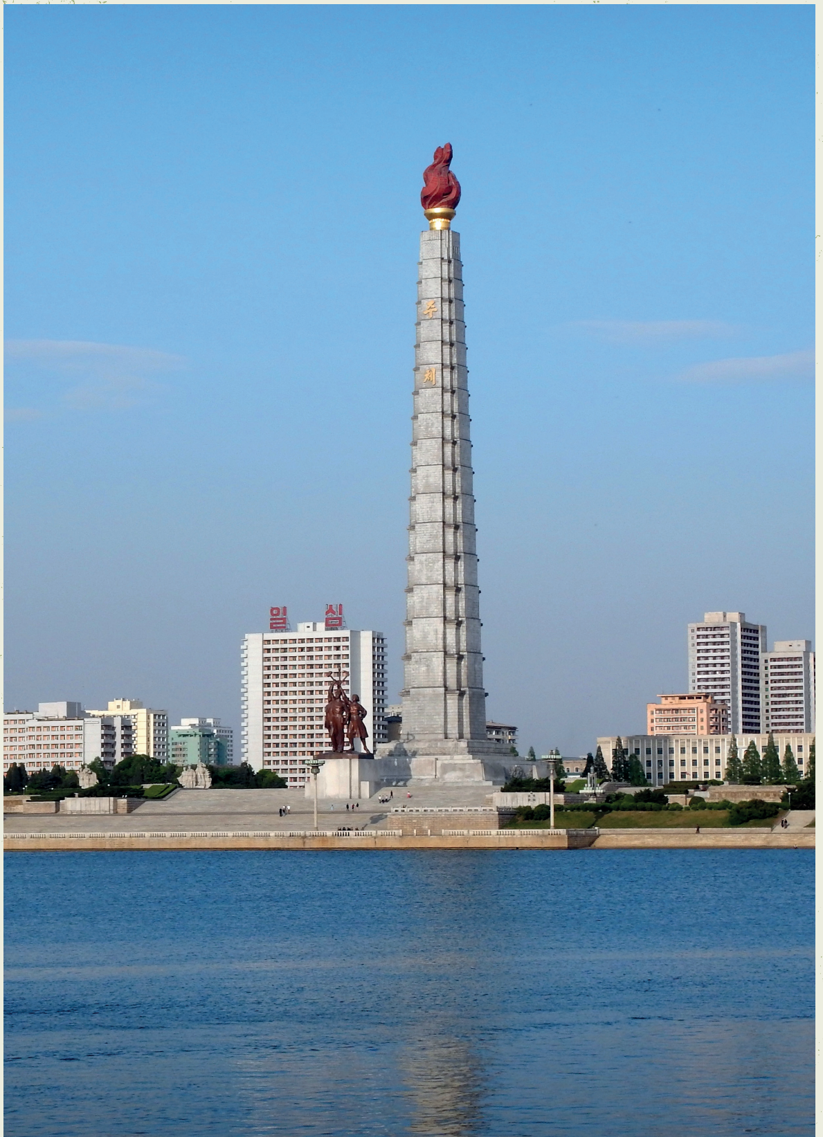
De Juche-toren in Pyongyang.