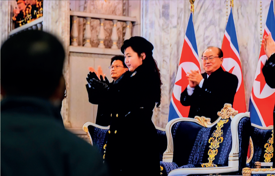
De dochter van Kim Jong-un in een televisieprogramma bij een militaire parade in Pyongyang, 2023.

nieuwe publicatie van Vermeer daarom van harte aan.