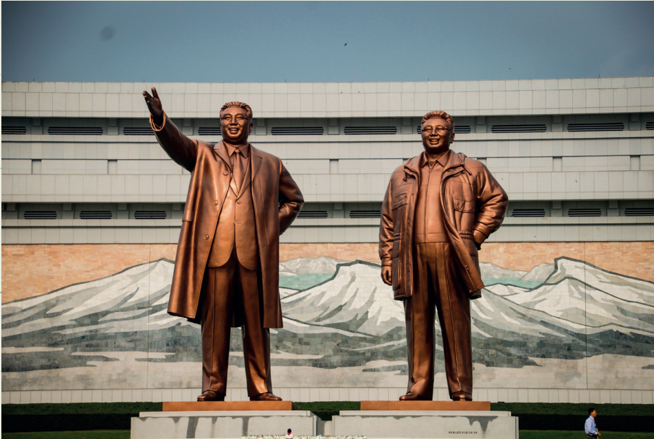
Reusachtige beeltenissen van vader Kim Il-sung en zoon Kim Jong-il.

maar dat met name de elite hier niet op zat te wachten. Vandaar dat er direct veel strijd was tussen zendelingen en Koreaanse gelovigen enerzijds, en de gevestigde orde anderzijds. Kim Il-sung pakte de christenen hard aan na 1945. Hij slaagde erin de zichtbare kerk volledig te laten verdwijnen.