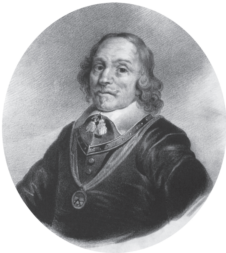
Maarten Harpertsz. Tromp (1598-1653). Lithografie door Carel Christiaan Anthony Last (1808-1876). Particuliere collectie, Alkmaar