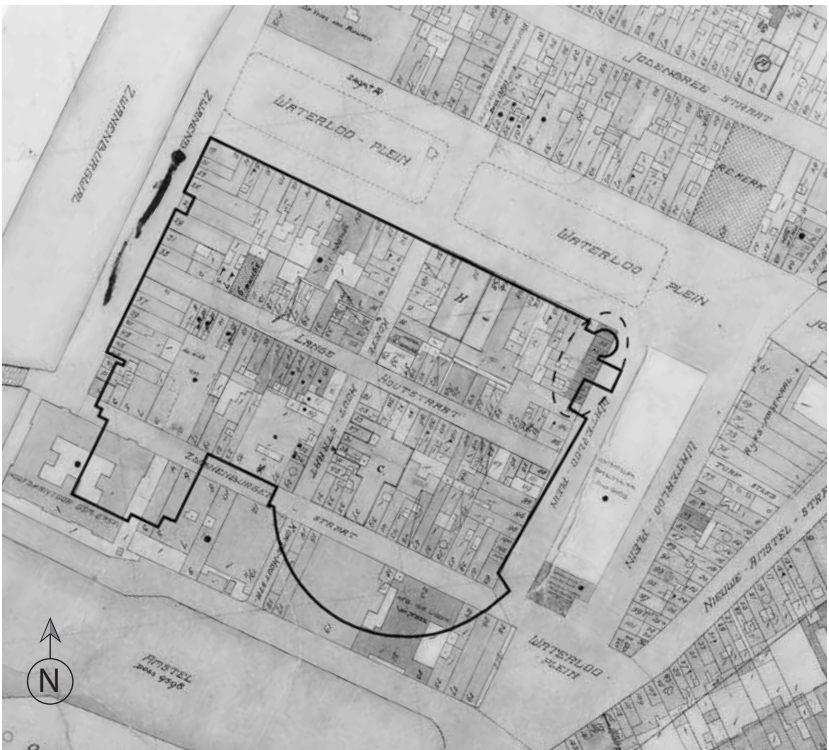
Kadastrale kaart van het Waterlooplein in 1918. Rechtsboven de Mozes en Aäronkerk, schuin links ertegenover binnen de stippellijn huizenrij 64-78. De zwarte lijn geeft de contouren aan van het huidige stadhuis/Muziektheater.